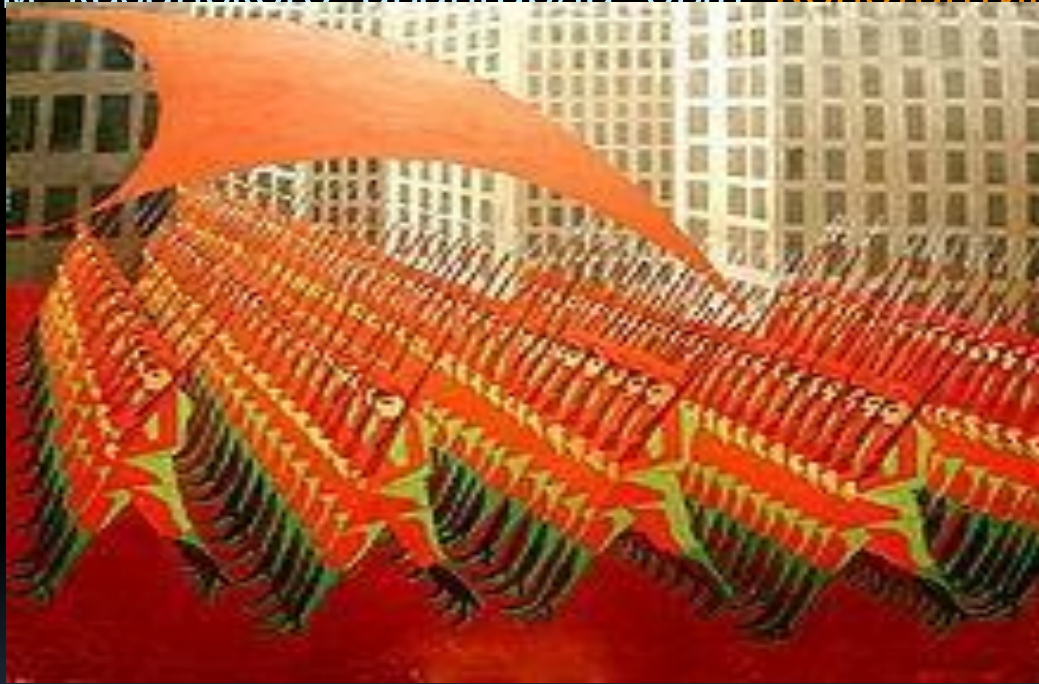
«Красная армия» (1917), Национальная художественная галерея «Хазинэ»

В 1920-е годы самостоятельное течение художников, писавшее в авангардном стиле, сложилось в Казани . В 1920-е годы самостоятельное течение художников, писавшее в авангардном стиле, сложилось в Казани. Лидером казанского авангарда был Константин Чеботарёв .