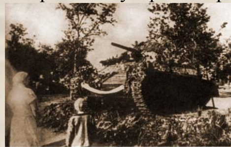
Танк Т-70, установленный на могиле танкистов, погибших при освобождении г. Орла. 1943 г.

В память о павших танкистах над их братской могилой был установлен танк Т-70, который доставили с опушки Медведевского леса. Орудие танка было направлено на Запад, где ещё предстояли бои за Родину. С этих памятных дней 18 августа 1943 г. Первомайский сквер был переименован в сквер Танкистов.