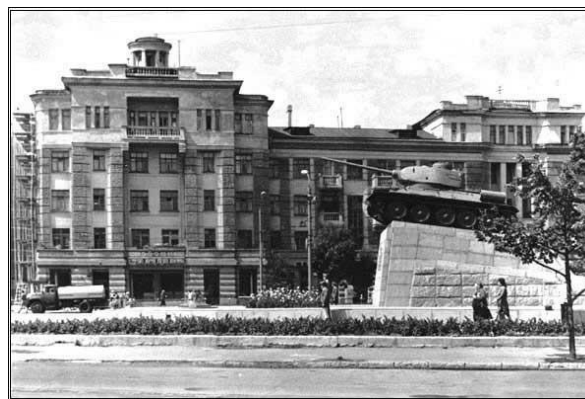
Танк Т-34, установленный на площади перед сквером в 1968 году