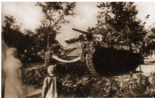
Танк Т-70, установленный на могиле танкистов, погибших при освобождении г. Орла. 1943 г.

Задача №1. В 1943 году в Сквере Танкистов в память о воинах, погибших при освобождении города Орла от немецко-фашистских захватчиков, над их братской могилой был установлен танк Т-70. В 1968 году был открыт мемориал : танк памяти Т-34 был установлен на площади перед сквером. В какую годовщину празднования Дня освобождения города Орла от немецко-фашистских захватчиков произошло данное событие?