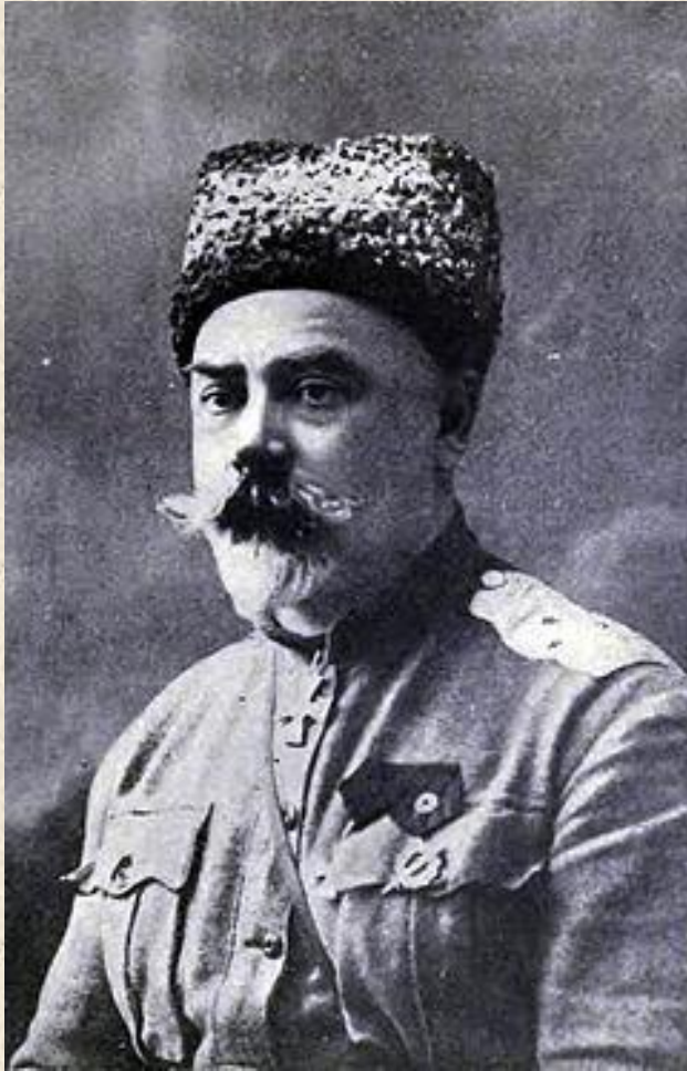
АНТОН ИВАНОВИЧ ДЕНИКИН (4 февраля 1872- 8 августа 1947)