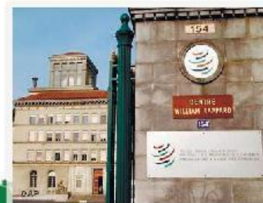
Штаб-квартира в Женеве