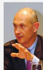
Лами Паскаль генеральный директор ВТО