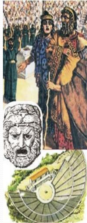
Театр Диониса в Афинах. Маски