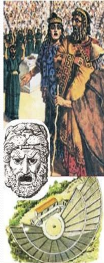
Театр Диониса в Афинах. Маски