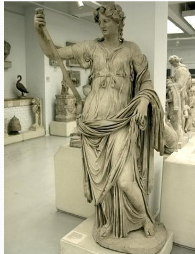
Талия – муза комедии