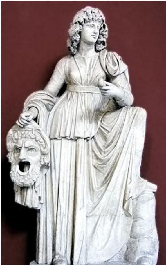
Мельпомена – муза трагедии

Очень часто древнегреческие авторы брали сюжеты для своих пьес из мифов .