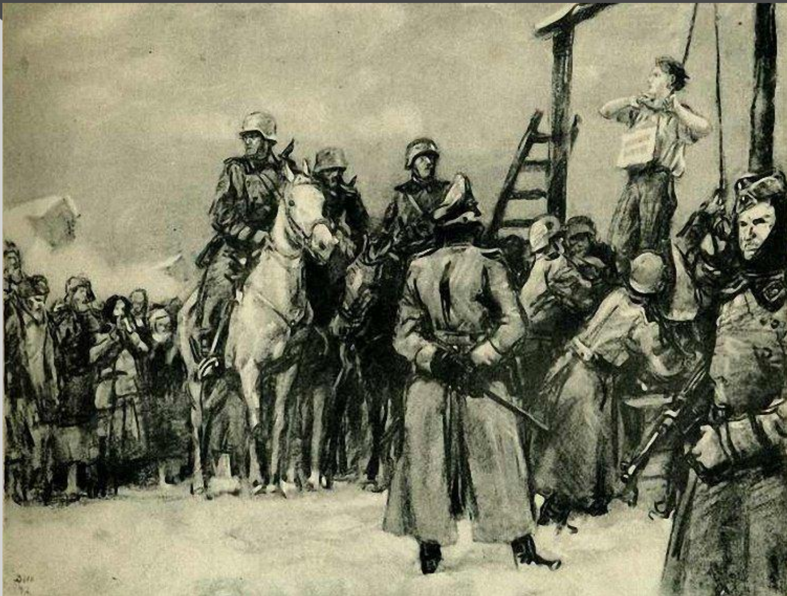
Смерть партизанки. Из серию рисунков «Не забудем, не простим!» 1942