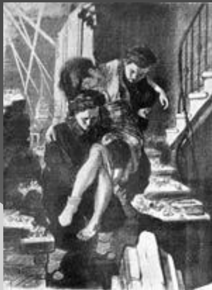
Серия "Ленинград в дни блокады". В очаге поражения