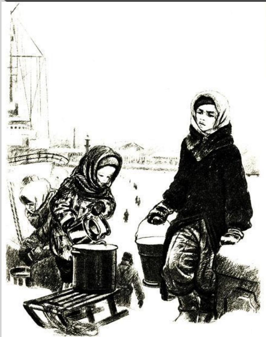
Серия "Ленинград в дни блокады". На Неву за водой. 1942