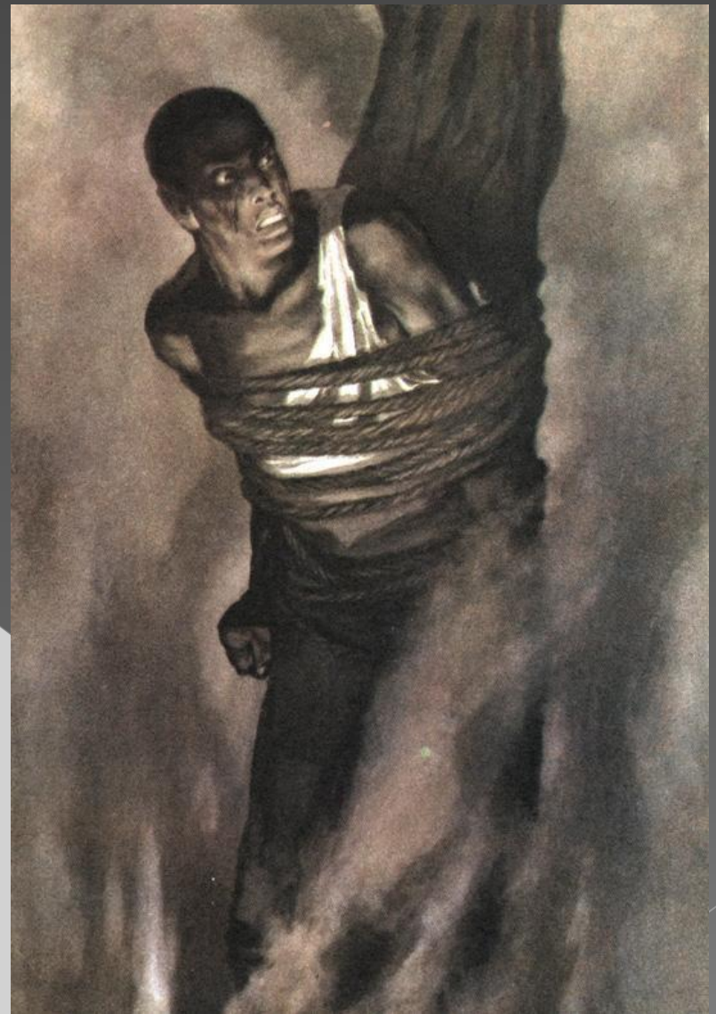
«Костры Линча» (Из серии рисунков «Маяковский об Америке»)