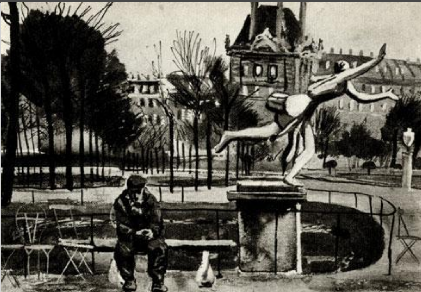
А. А. Дейнека. Тюильри. 1935

Острое видение контрастов зарубежной действительности присуще парижским и римским пейзажам А. А. Дейнеки. Художник не может отдаться спокойному очарованию величавой архитектуры и статуй, как это было не раз в предреволюционных зарубежных сериях графиков; на этом прекрасном фоне его глаз замечает и фигуру безработного, и зловещие самоуверенные фигуры служителей церкви. В кругу таких произведений, как листы Дейнеки, и рождается публицистическая страстность, политическая непримиримость, свойственная советской графике.