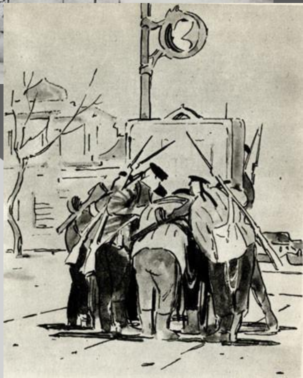
Севастополь 1944 г. Бумага, карандаш