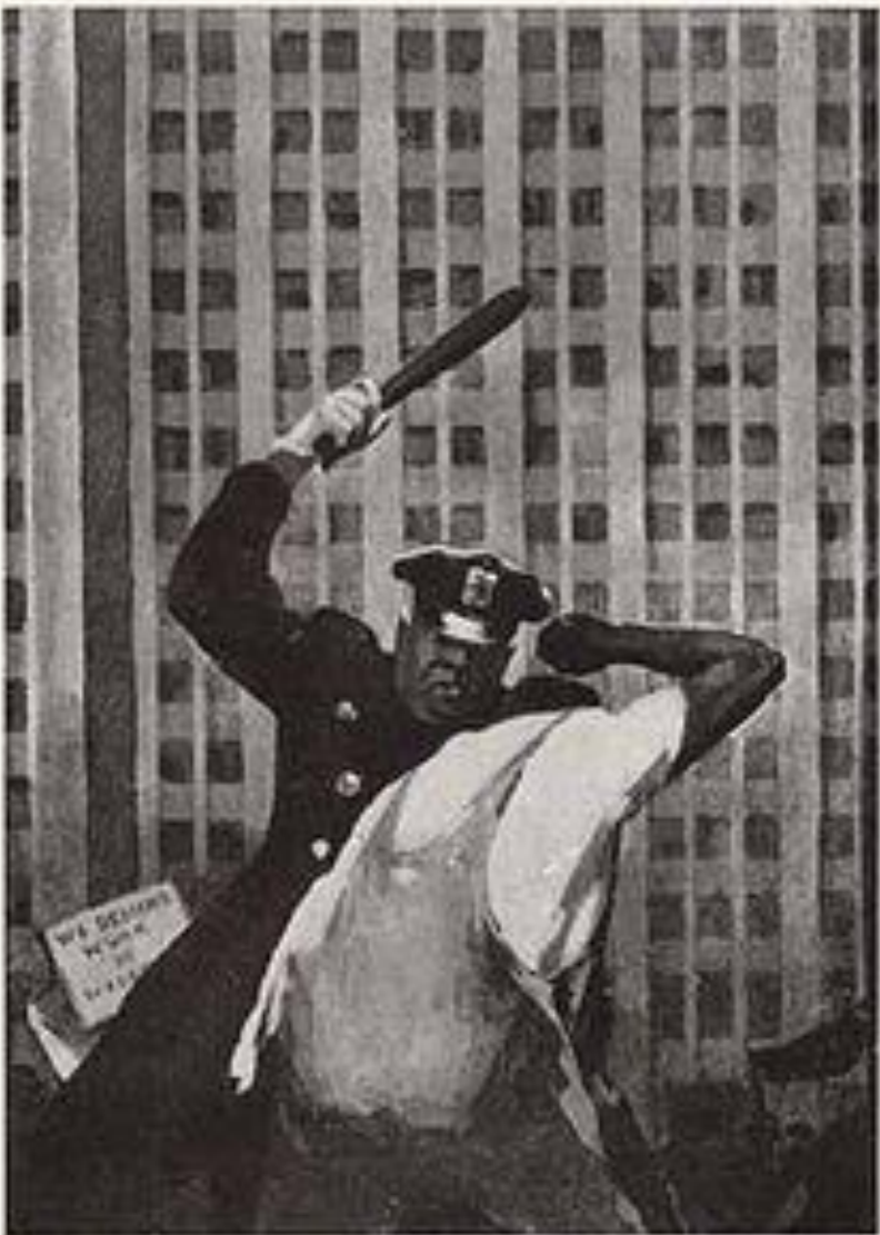
«Разгон демонстрации» (Из цикла «Вот она Америка!»)