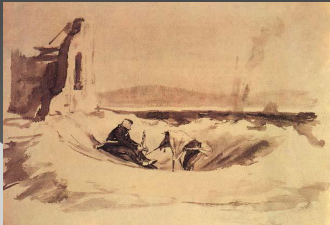
«Фотография для партдокумента» из серии «Севастопольский альбом». 1941-1942 гг.