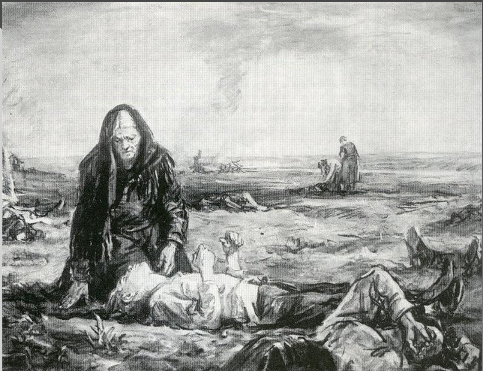
Мать. Из серию рисунков «Не забудем, не простим!» 1942