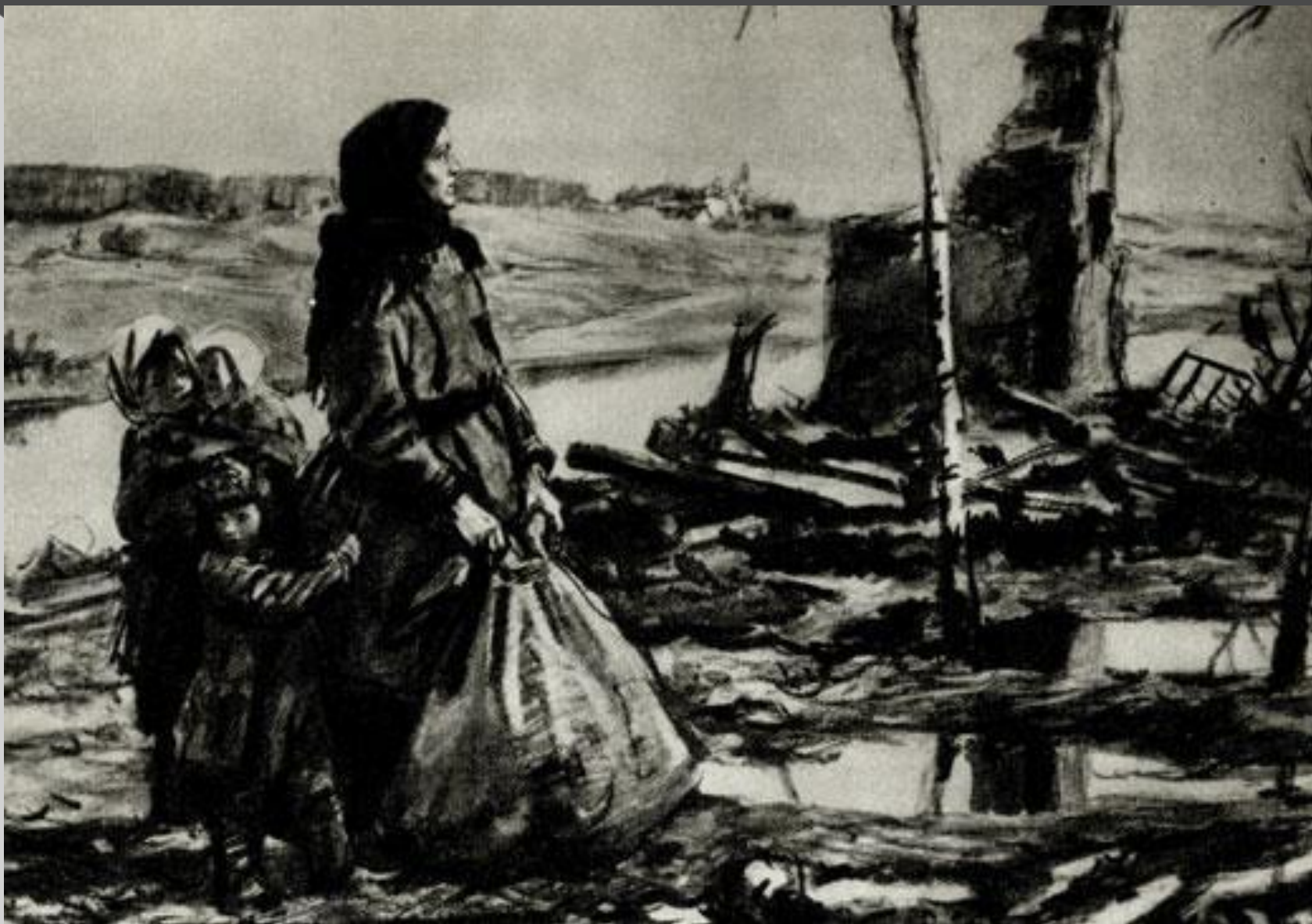
Возвращение. Из серию рисунков «Не забудем, не простим!» 1942