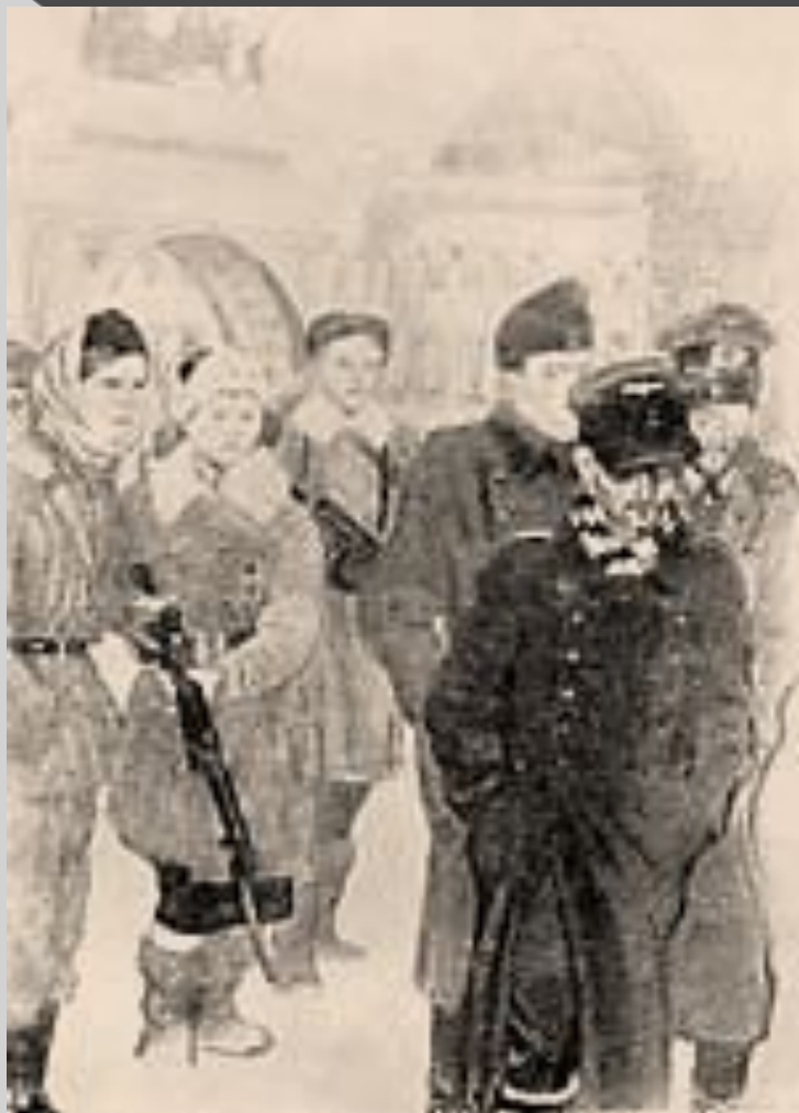
Серия "Ленинград в дни блокады". Пленные немцы в Ленинграде