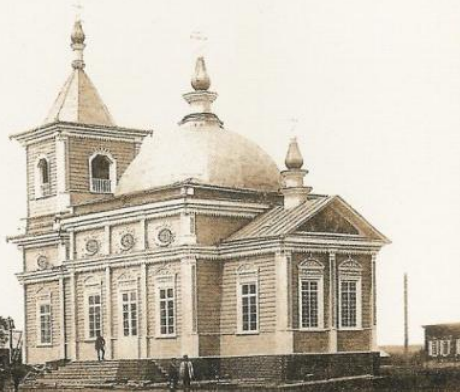
Храм в с. Рыковском

Методы исследования: историко-правовой, формально-юридический, логико-юридический, сравнительно-правовой, конкретно-социологический и др.