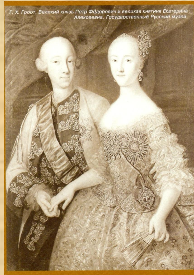
Екатерина II и Петр III