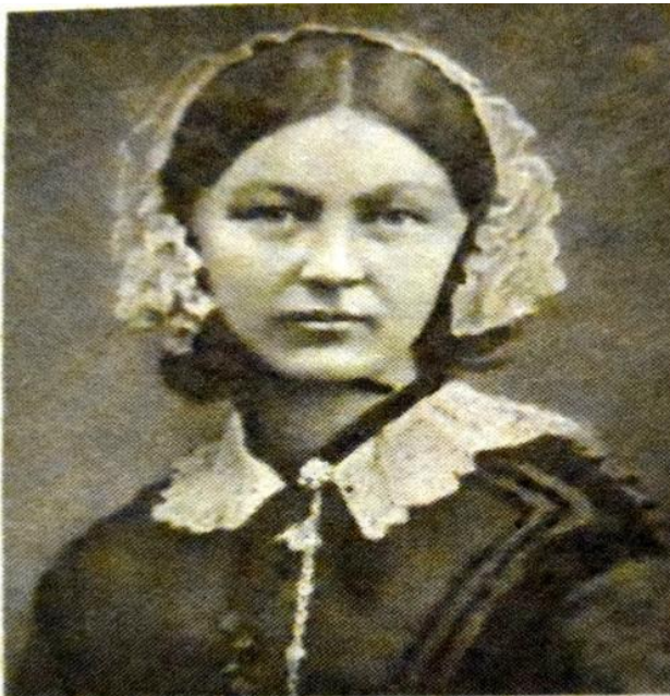
Англичанка Флоренс Найтингейл — самая известная сестра милосердия.

Флоренс Найтингейл родилась 12 мая 1820 г. в аристократической английской семье. Она получила достаточно всестороннее образование, которое тогда получали только мужчины. Современники Флоренс Найтингейл отмечали, что она была талантливой личностью и свои способности могла реализовать и самых различных сферах деятельности, но ее выбором стала медицина.