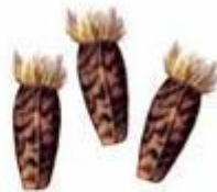
Плоды лопуха (репейника)