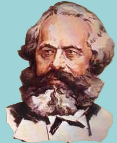
К. Маркс. «Восемнадцатое брюмера Луи Бонапарта».

Люди сами делают свою историю, но они её делают не так, как им вздумается, при обстоятельствах, которые не сами они выбрали, а которые непосредственно имеются налицо, даны им и перешли от прошлого.