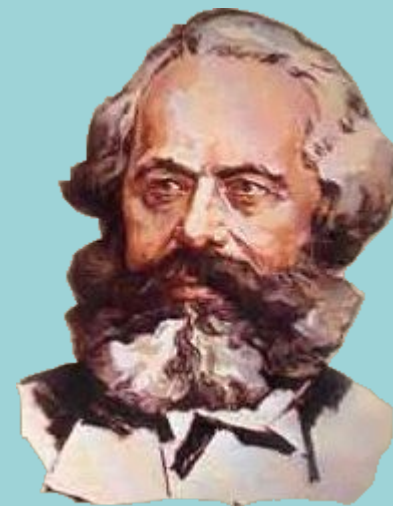
К. Маркс и Ф. Энгельс. «Немецкая идеология».

Людей можно отличать от животных по созданию, по религии – вообще по чему угодно. Сами они начинают отличать себя от животных, как только начинают производить необходимые им средства к жизни, – шаг, который обусловлен их телесной организацией. Производство необходимо им средства к жизни, люди коварным образом производят и самое материальную жизнь.