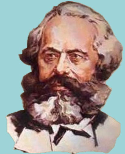
К. Маркс. «К критике политической экономики».

В общественном производстве своей жизни люди вступают в определённые, необходимые, от их воли не зависящие отношения – производственные отношения, которые соответствуют определённой ступени развития их материальных производительных сил. Совокупность этих производственных отношений составляет экономическую структуру общества, реальный базис, на котором возвышается юридическая и политическая надстройка и которая соответствует определённым формам общественного сознания.