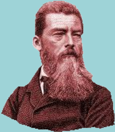
Л. Фейербах. «Сущность христианства».

... понятие божества совпадает с понятием человечества. Все божественные определения, все определения делающие Бога богом, суть определения рода – определения, ограниченные отдельным существом, индивидом и не ограниченные в сущности рода и даже в его существовании, поскольку это существование соответственно проявляется только во всех людях, взятых как нечто собирательное. <...> Бог есть понятие рода как индивида , понятие, или сущность рода; он как всеобщая сущность, как средоточие всех совершенств, всех качеств, свободных от действительных или мнимых границ индивида, есть в то же время существо отдельное, индивидуальное.