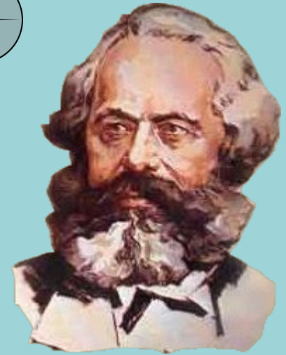
К. Маркс. «К критике политической экономики».

На известной ступени своего развития материальные производительные силы общества приходят в противоречие с существующими производственными отношениями, или — что является только юридическим выражением последних — с отношениями собственности, внутри которых они до сих пор развивались. Из форм развития производительных сил эти отношения превращаются в их оковы. Тогда наступает эпоха социальной революции. С изменением экономической основы более или менее быстро происходит переворот во всей громадной надстройке.