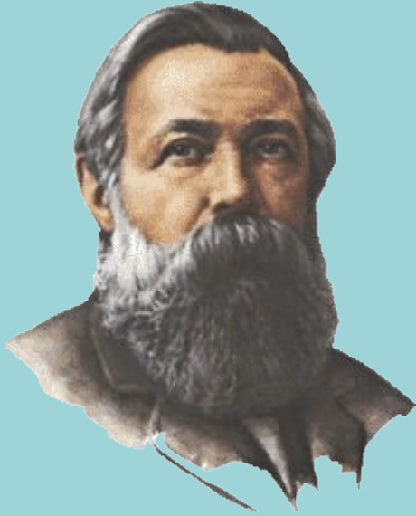
Ф. Энгельс. «Людвиг Фейербах и конец классической немецкой философии».

Первый толчок дала книга Штрауса «Жизнь Иисуса», вышедшая в 1835 году. Против изложенной в этой книге теории возникновение эвангельских мифов выступил позднее Bruno Bauer, доказывавший, что целью ряд эвангельских рассказов сфабрикован самими авторами евангелий. Спор между Штраусом и Bauer велся под видом философской борьбы между «самосознанием» и «субстанцией». Вопрос о том, возникли ли эвангельские рассказы о чудесах путём бесознательного, основанного на традиции, создания мифов в недрах общины или же они были сфабрикованы самими евангелистами, — разросся до вопроса о том, что является главной действительной силой во всемирной истории: «субстанция» или «самосознание».