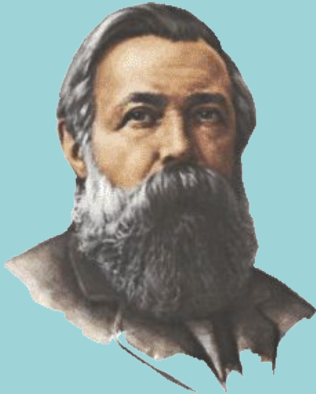
Ф. Энгельс. «Людвиг Фейербах и конец классической немецкой философии».

... Гегель вынужден был строить систему, а философия была установлена по установленным порядку, должна была завершиться абсолютной истиной того или иного рода. И тот же Гегель, который <...> подчёркивает, что эта вечная истина есть не что иное, как сам логический (resp.: исторический) процесс, <...> видит себя вынужденным положить конец этому процессу, так как надо же было ему на чём-то закончить свою систему. <...> А именно, нужно было так представить себе конец истории: человекество приходит к познанию <...> абсолютной истины и объявляет, что это познание абсолютной истины достигнуто в гегелевской философии.