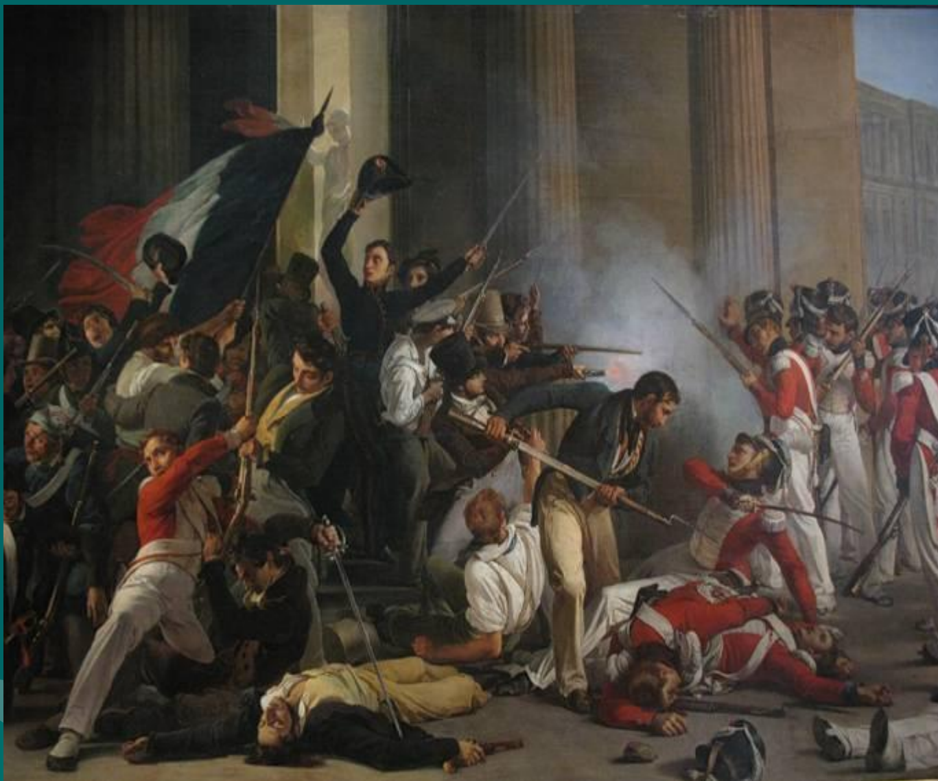
Штурм дворца Тюильри, 1830 г.