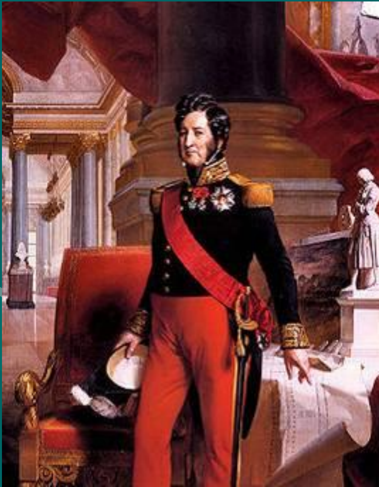
Луи Филипп Орлеанский