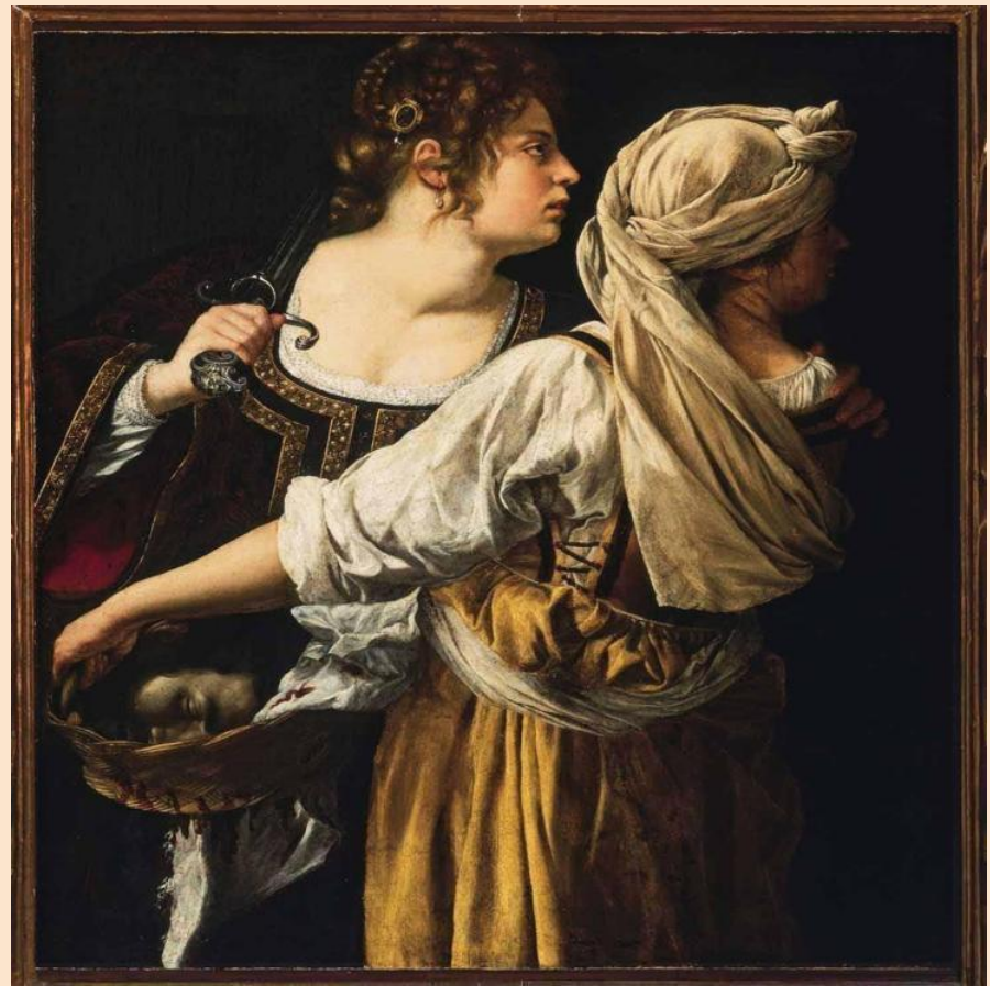
“Юдифь и ее служанка”, Джанилески (ок. 1613-1614 г.)