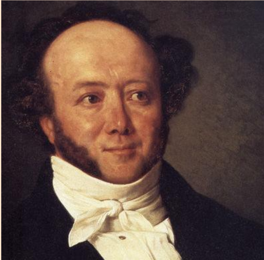
Альберт Бициус, 1844 г.

Альберт Бициус (Джереми Готтельф)- выдающийся швейцарский народный писатель.