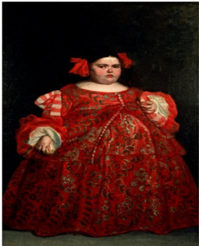
Портрет Евгении Мартинес “la monstra”, Хуан Карреньо де Миранда (1680 г.)