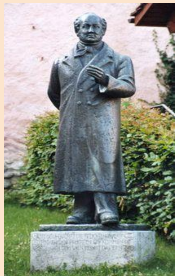
Альберт Бициус, статуя в Муртене, Франция

Для лечения зоба у Готтельфа использовали раствор Люголя , что привело к йод-индуцированному тиреотоксикозу и смерти от сердечной недостаточности.