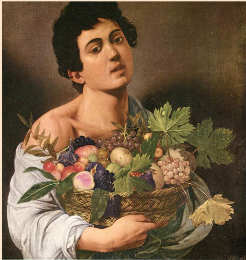
«Юноша с корзиной фруктов», Караваджо (ок. 1593-1594 г.)