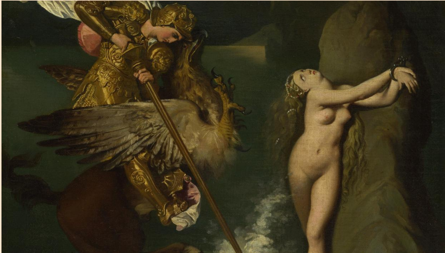
“Руджиеро, освобождающий Анжелику”, Жан Огюст Доминик Энгр. (1819 г.)