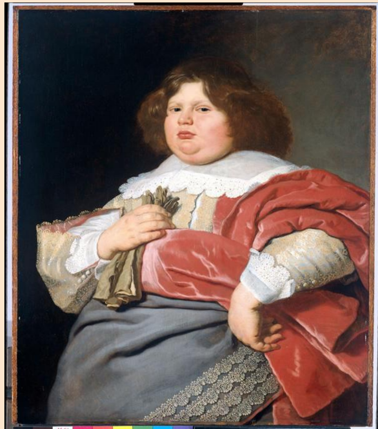
Портрет Жерарда Андреаса Беккера, работа нидерландского живописца Бартоломеуса ван дер Хелста