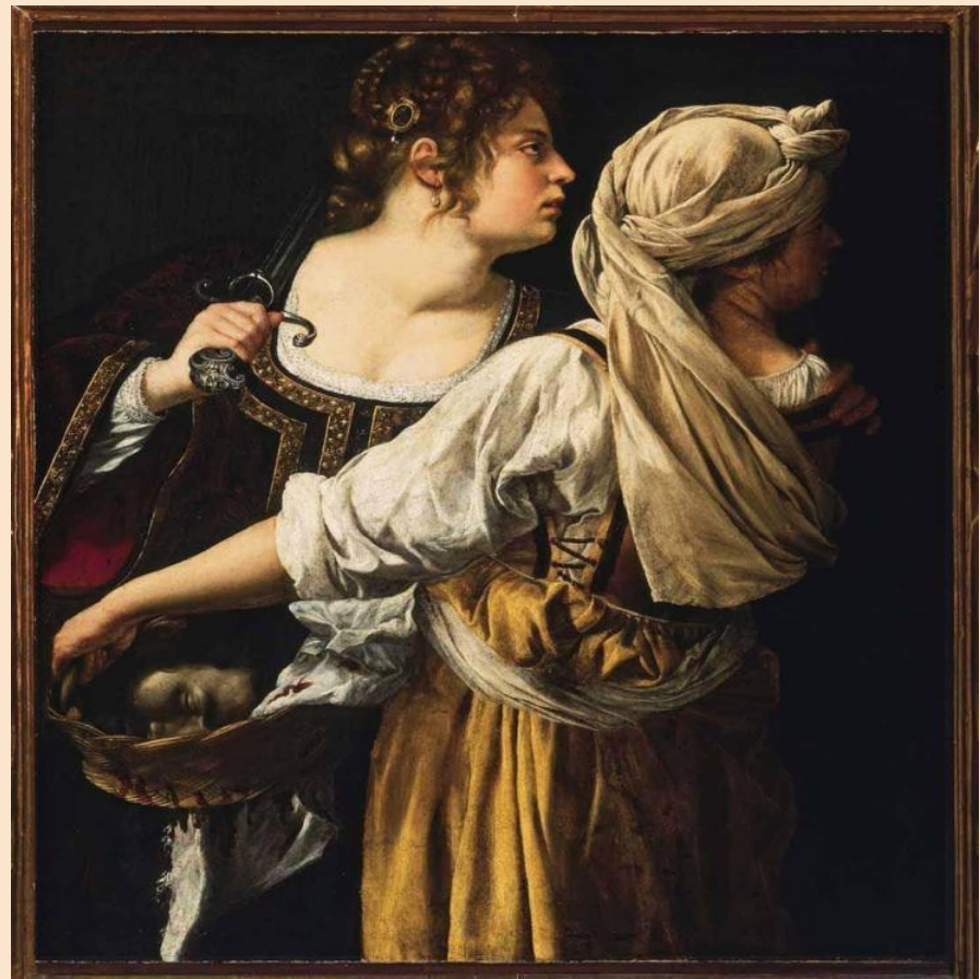
“Юдифь и ее служанка”, Джанилески (ок. 1613-1614 г.)