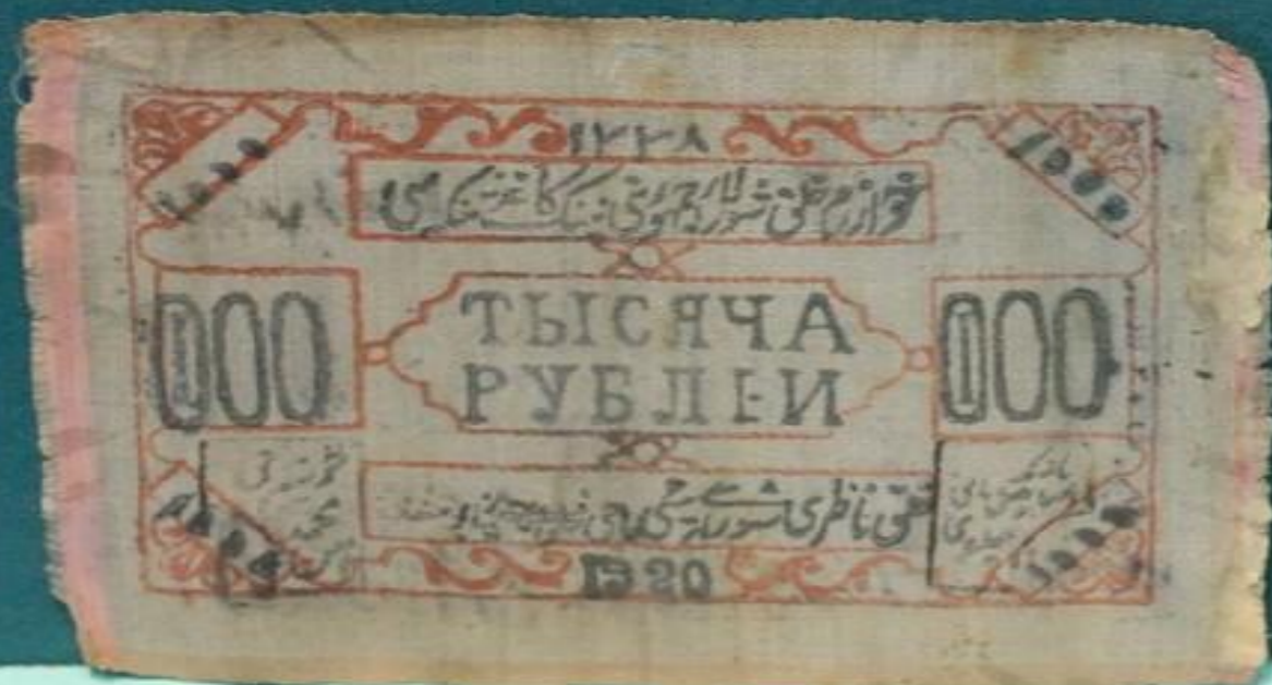
Шелковые деньги Хорезмской республики