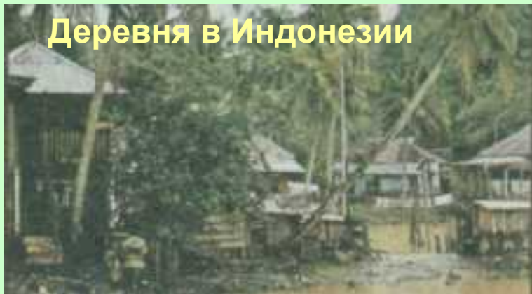
Деревня в Индонезии