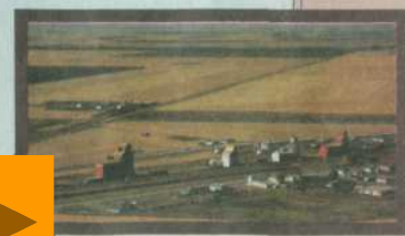
Типичный пейзаж в «пшеничном поясе» США