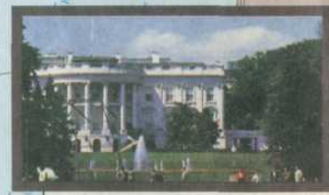
Белый дом — резиденция президента США в Вашингтоне

ЗАДАНИЕ 6. Найди эти мегалополисы на карте. Нанеси их на контурную карту.