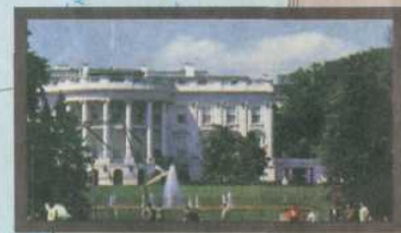
Белый дом — резиденция президента США в Вашингтоне

ЗАДАНИЕ 6. Найди эти мегалополисы на карте. Нанеси их на контурную карту.