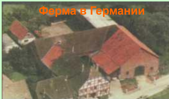
Ферма в Германии

В странах кочевого скотоводства постоянные поселения отсутствуют.