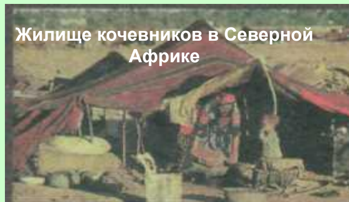
Жилище кочевников в Северной Африке

Наиболее распространена в США, Канаде, Австралии, странах Северной Европы.