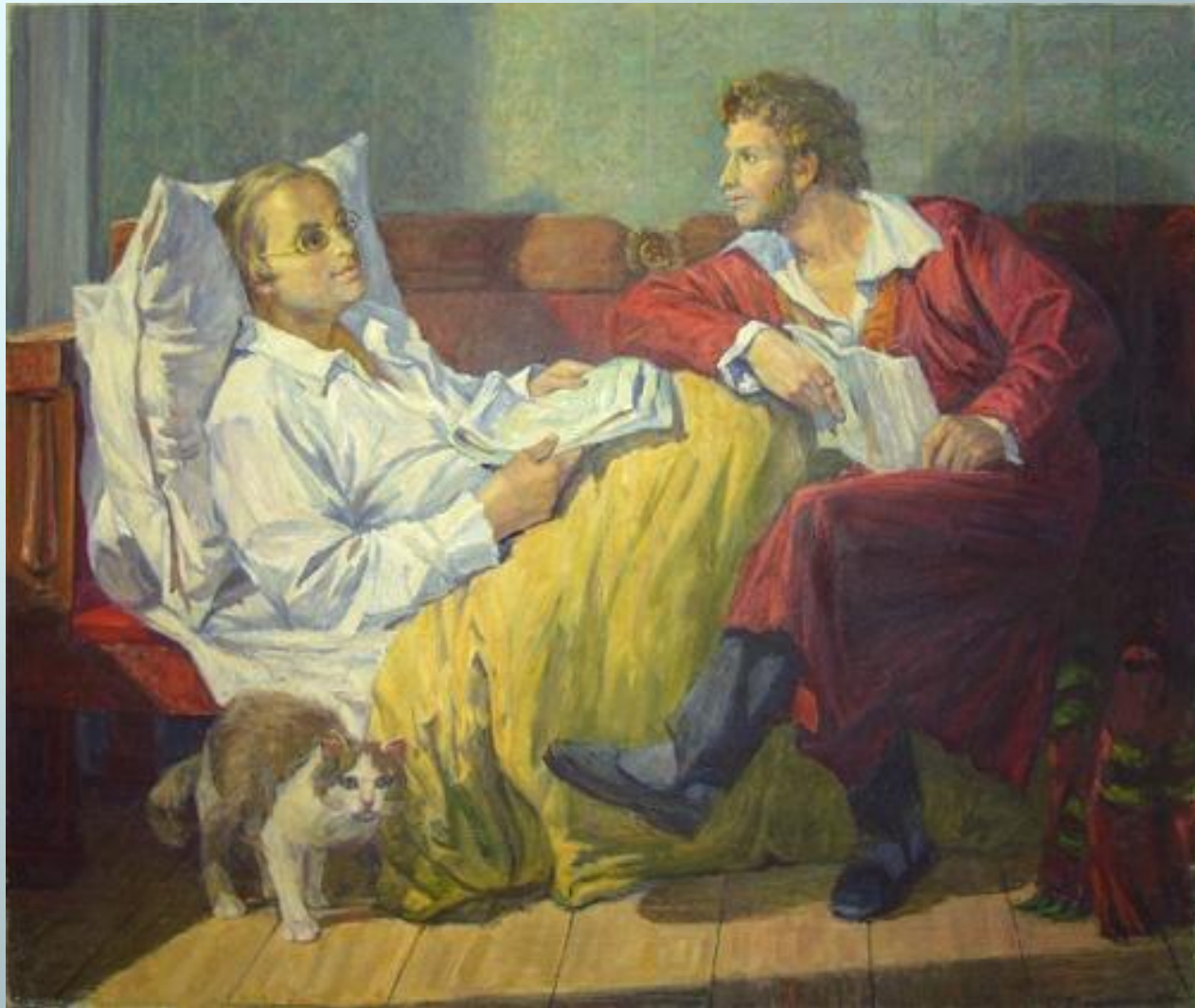
Встреча с А. Дельвигом