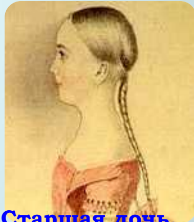
Старшая дочь, Мария Александровна Пушкина (1832-1919г.)