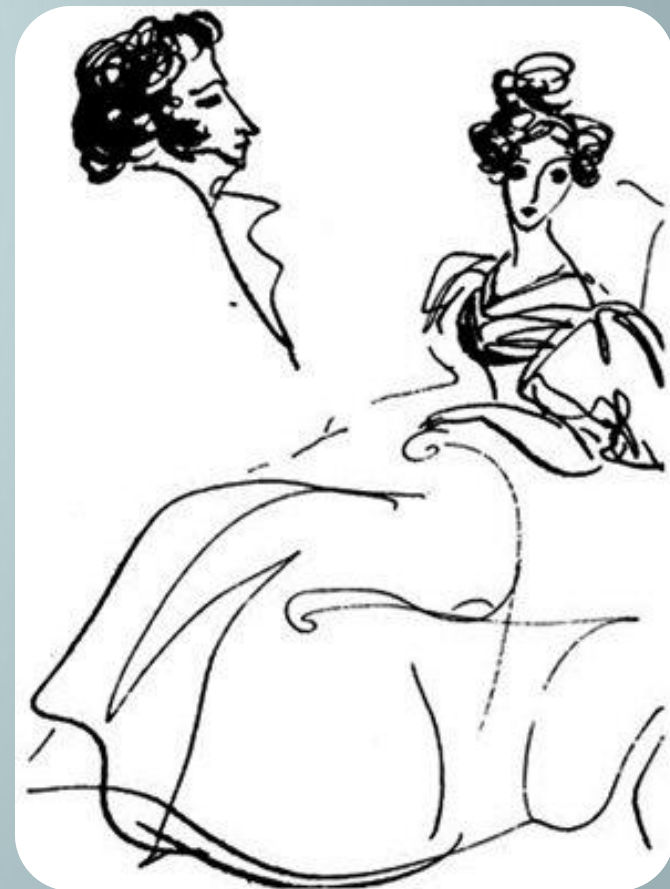
А. П. Керн