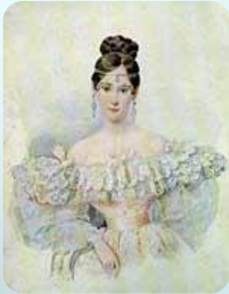
Жена, Наталья Николаевна Пушкина (1812-1863г.)