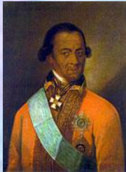
Прадедущка, Абрам Петрович Ганнибал