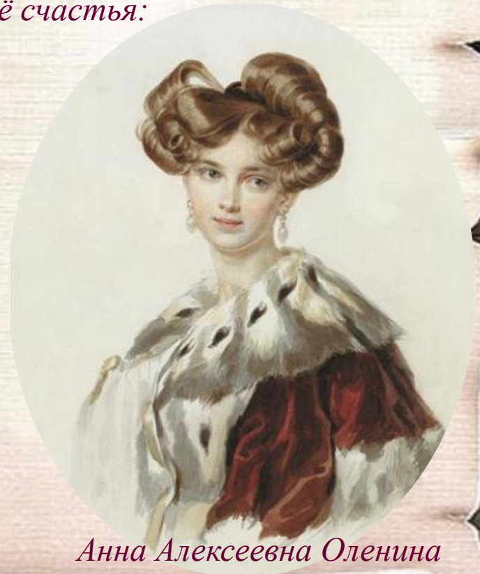
Анна Алексеевна Оленина

Я вас любил: любовь еще, быть может, В душе моей угасла не совсем; Но пусть она вас больше не тревожит; Я не хочу печалить вас ничем. Я вас любил безмолвно, безнадежно, То робостью, то ревностью томим; Я вас любил так искренно, так нежно, Как дай вам бог любимой быть другим. 1829