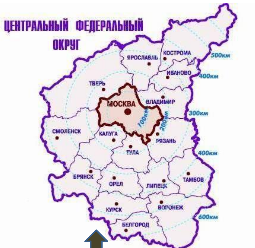
Центральный и Центрально-Черноземный районы