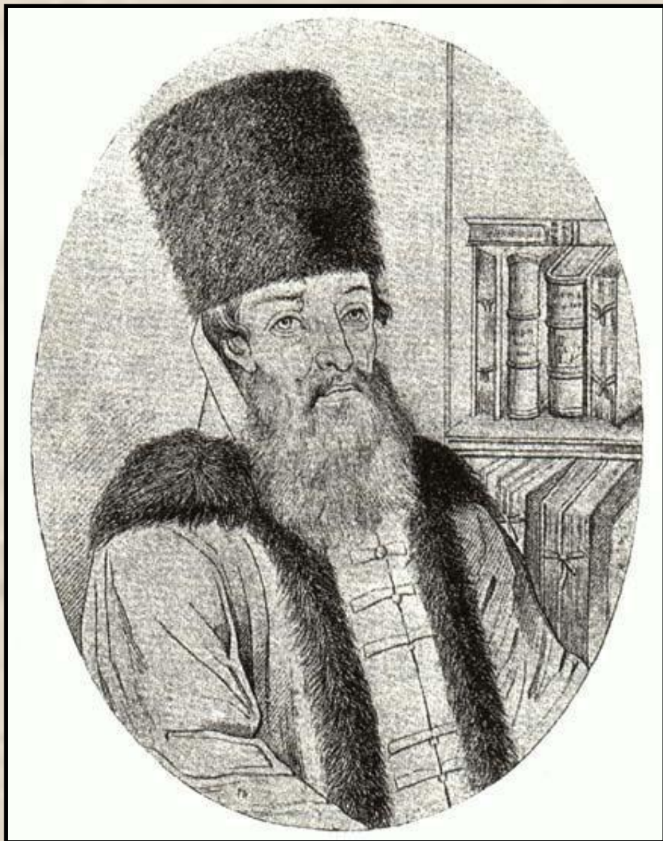
А.Л. Ордин- Нащокин