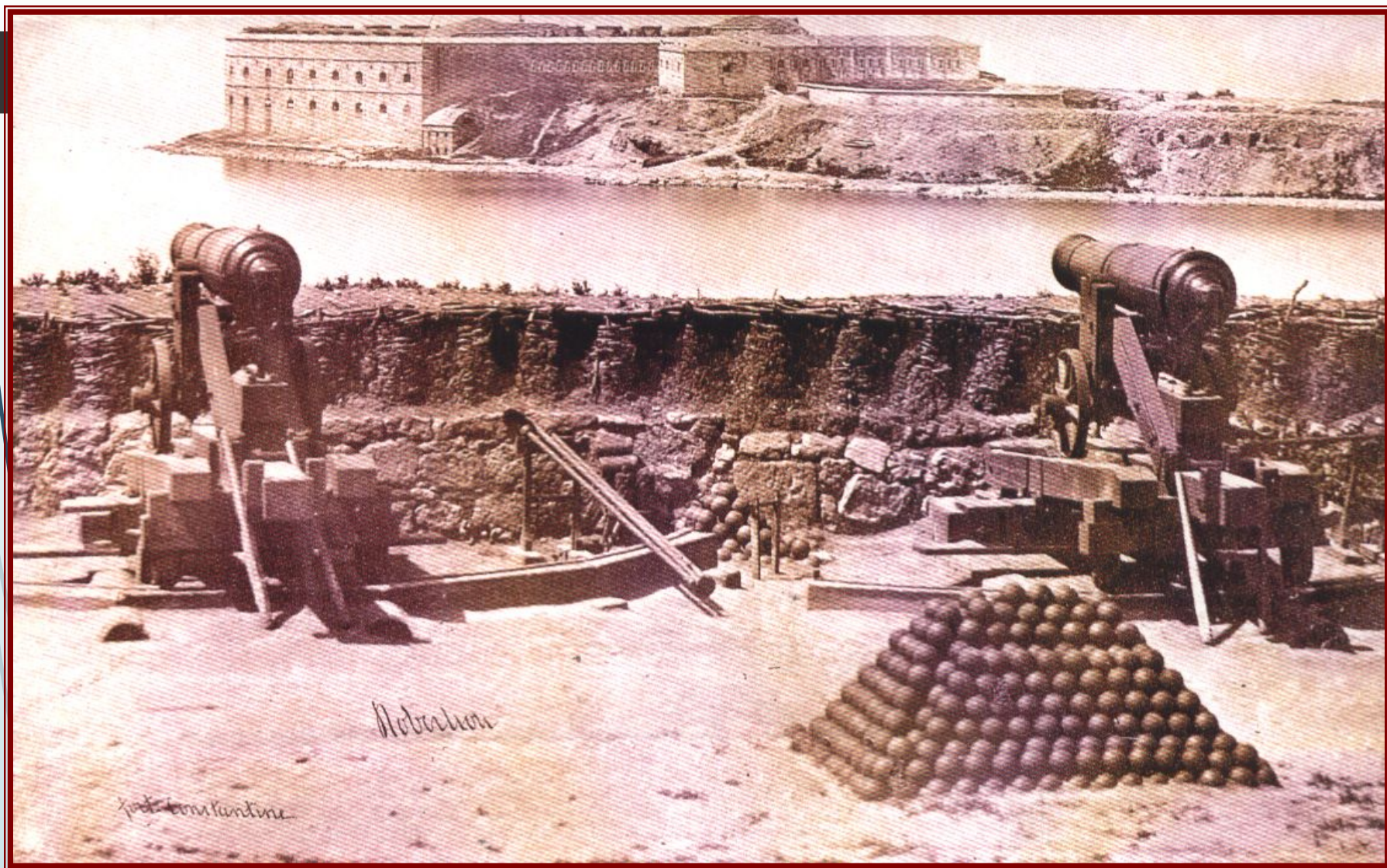
Константиновская батарея Севастополя