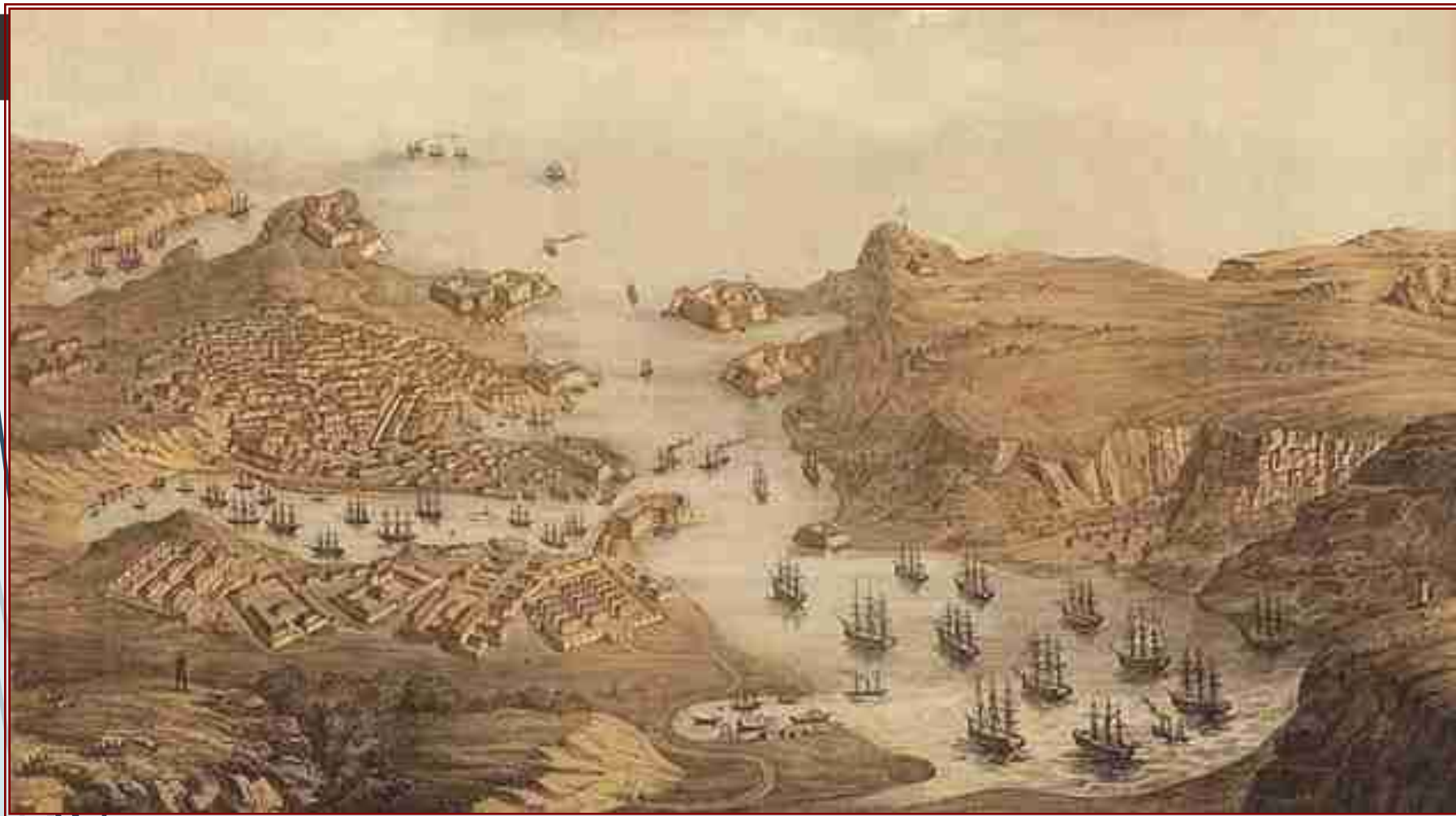
Вид на Севастопольскую бухту