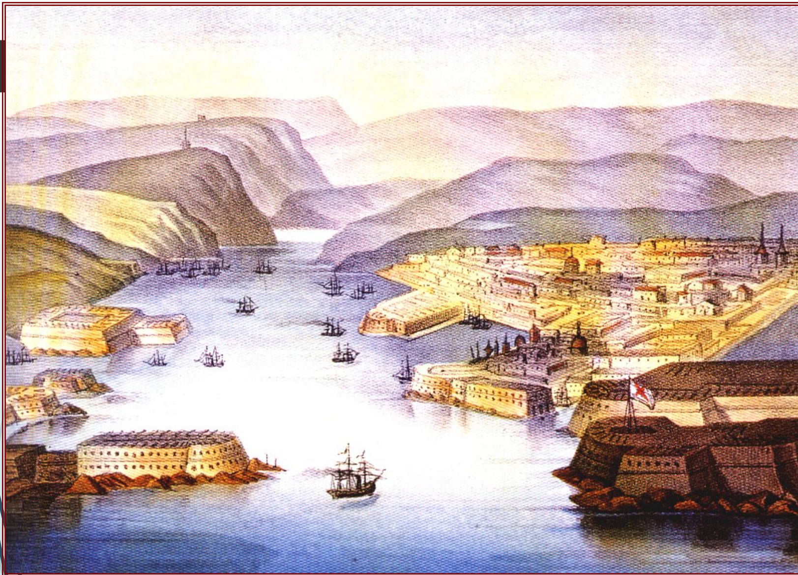
Вид на Севастополь