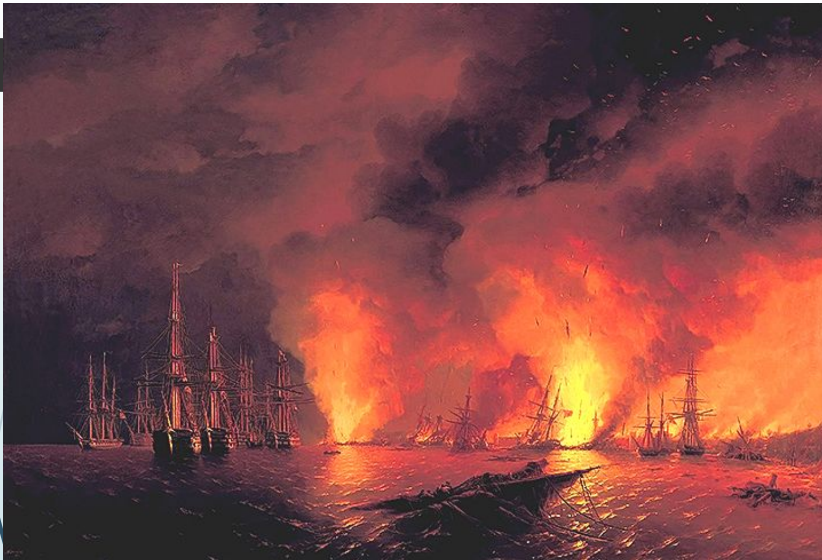
Синопский бой 1853год