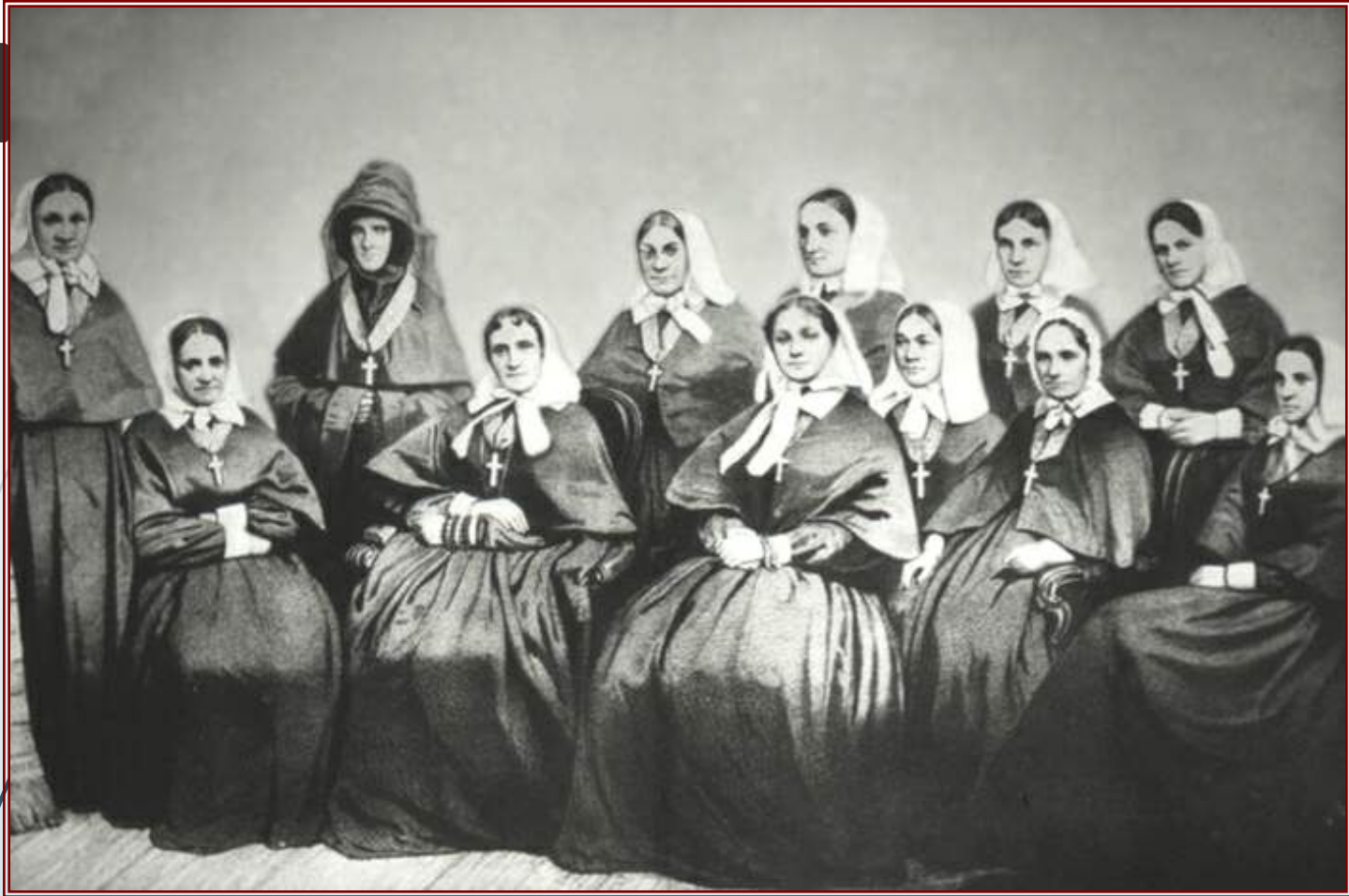
Даша Севастопольская - сестра милосердия, героиня обороны Севастополя в Крымскую войну