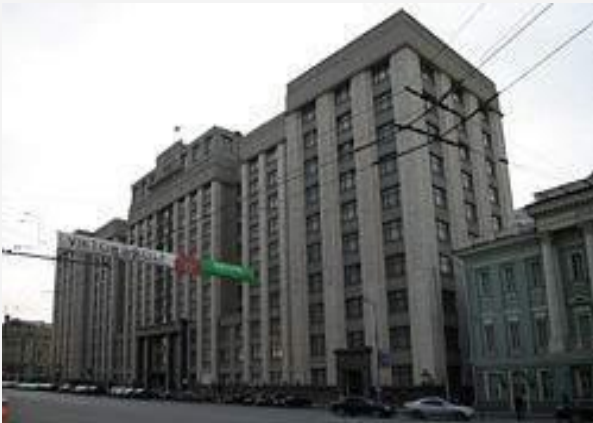
Здание Государственной думы