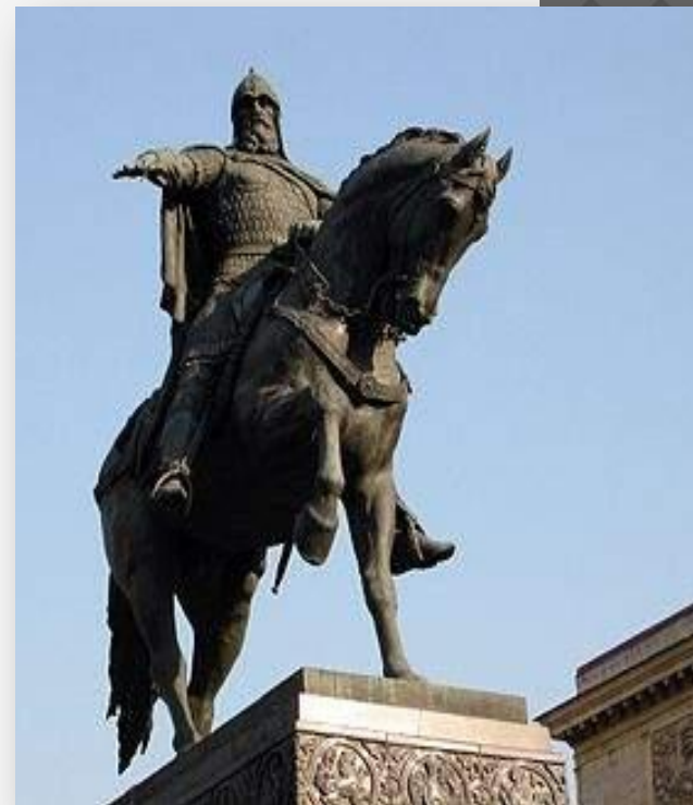
Памятник основателю Москвы Юрию Долгорукому