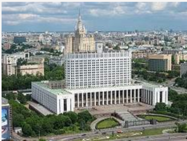
Дом Правительства России