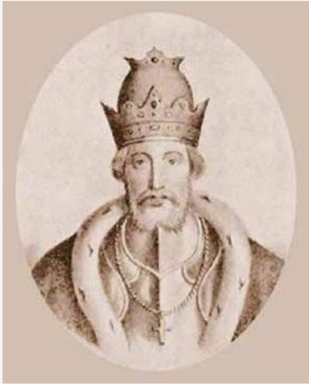
Князь Юрий III Данилович