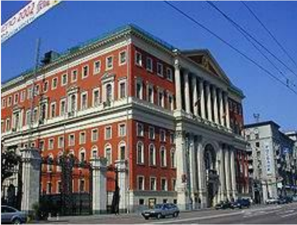
Здание Московской мэрии