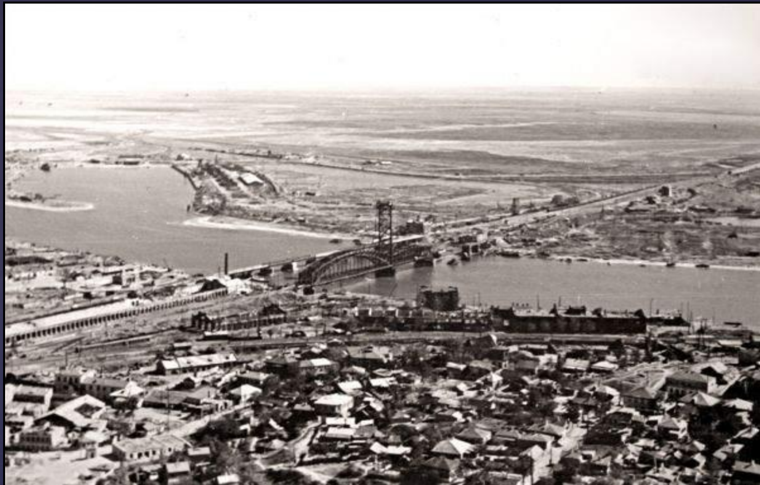
Западный мост г. Ростова-на-Дону в годы Великой Отечественной войны