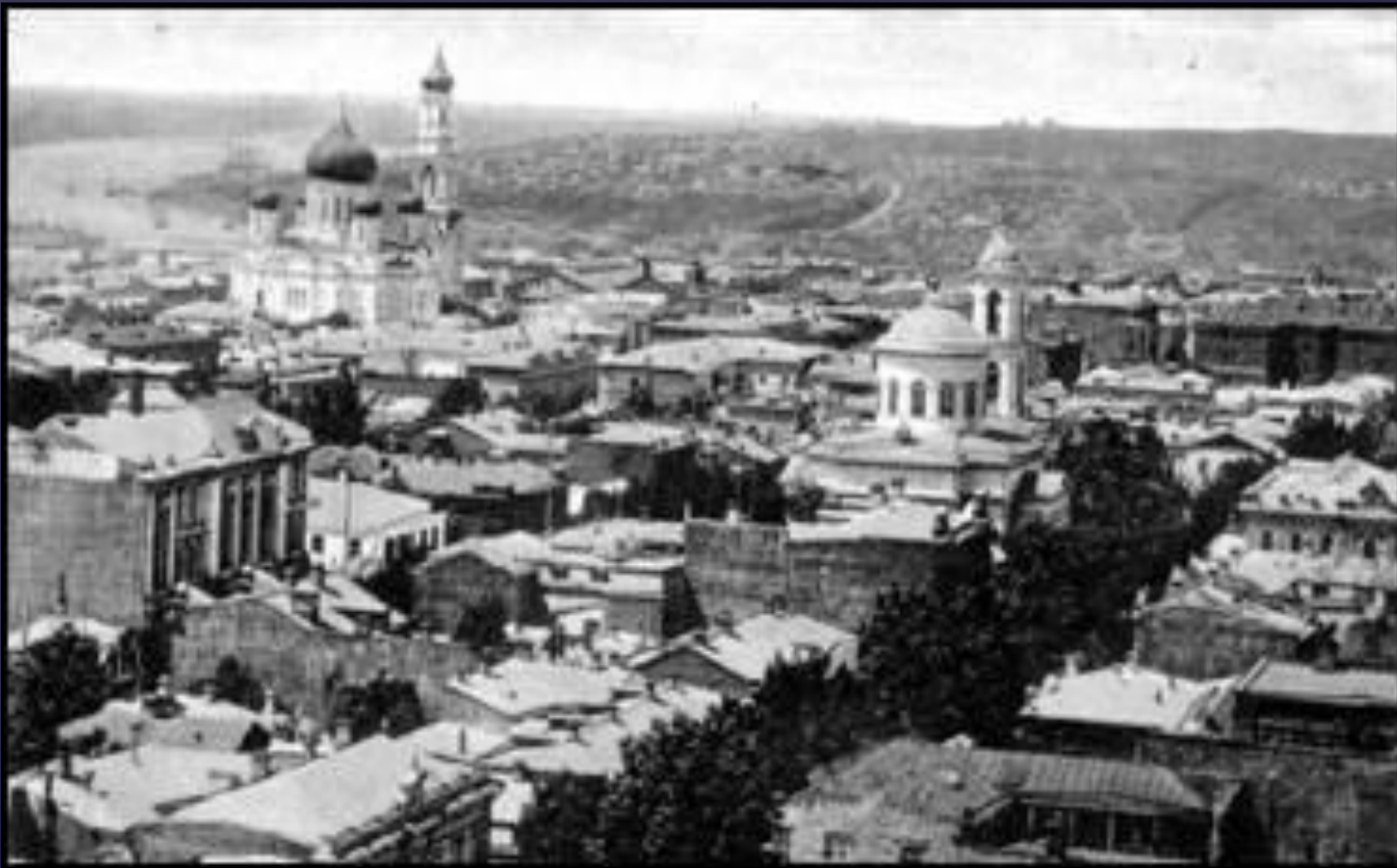
Общий вид города