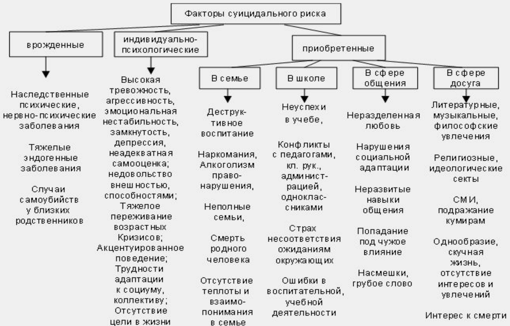
Схема работы по выявлению таких учащихся