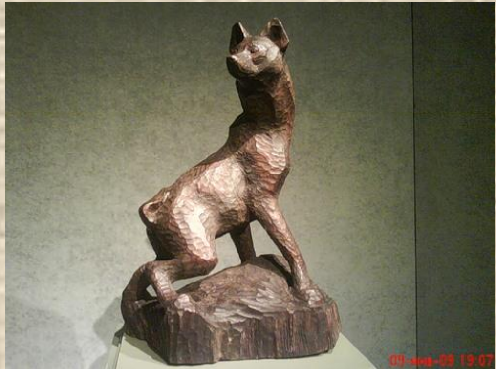
Скульптуры В. Ватагина.