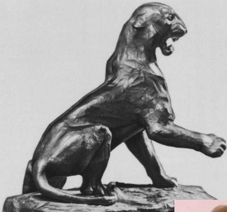
Скульптуры В. Ватагина.