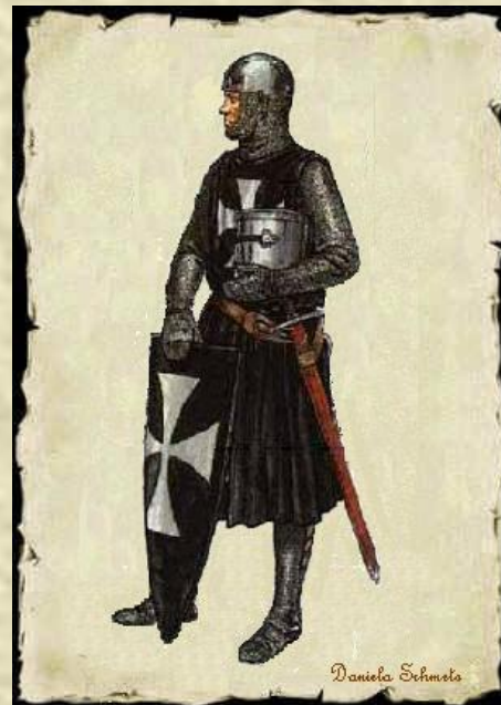
«Орден всадников госпиталя святого Иоанна Иерусалимского» -1113 г.