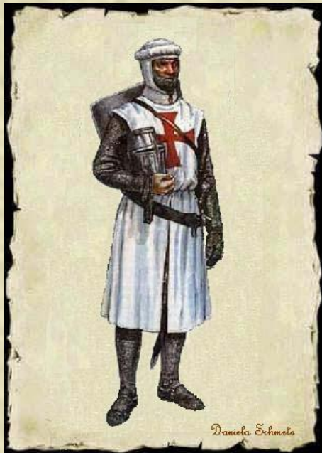
«Тайное рыцарство Христово и Храма Соломона» -1118 г.