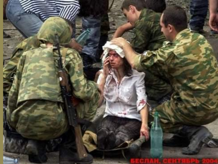
БЕСЛАН, СЕНТЯБРЬ 2004

Важно также иметь твёрдую установку на неприятие терроризма, чтобы на все подозрительные уговоры сказать решительное «Нет!».