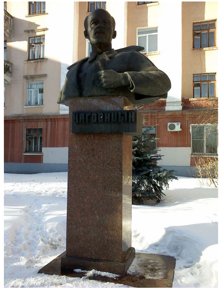
Памятник И. А. Наговицыну на Советской улице в Ижевске