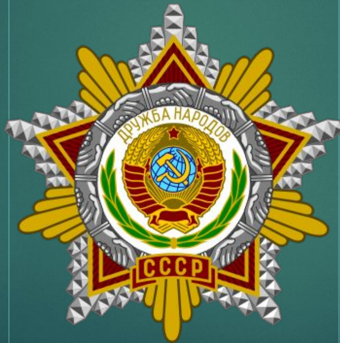
Орден Дружбы народов