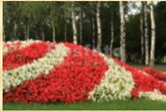
Бегония (постоянно цветущий летник)