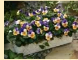
Виола (постоянно цветущий летник)