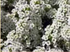
Алиссум (постоянно цветущий летник)