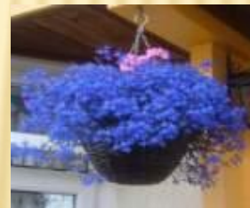
Лобелия (постоянно цветущий летник)