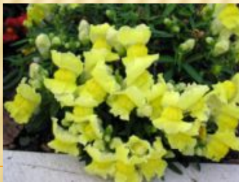
Львиный зев (постоянно цветущий летник )