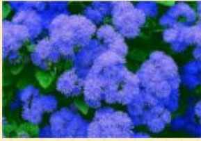
Агератум (постоянно цветущий летник)