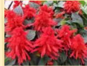
Сальвия (постоянно цветущий летник)