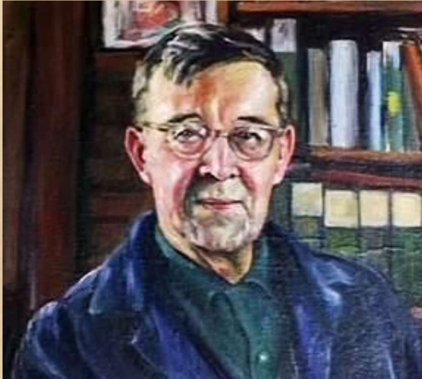
ПИТИРИМ СОРОКИН (1889 —1968) — русский, американский социолог и культуролог.

В научный оборот понятие было введено П. Сорокиным в 1927 г. Уровень социальной мобильности характеризует степень открытости общества, возможность перехода из одной группы населения в другую. Он выделил два основных типа мобильности: