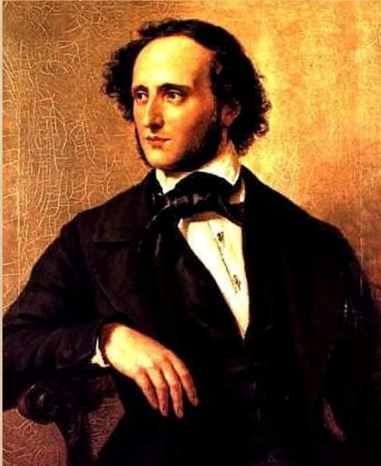
ФЕЛИКС МЕНДЕЛЬСОН (1809 – 1847) – немецкий композитор

ИСКУССТВО. Человек обретает признание и известность, а его работы начинают стоить баснословных денег. Среди самых известных литераторов Франции 13 % были из рабочей среды. Феликс Мендельсон умело организовал, чтобы под его свадебный марш венчались принцесса Германии Виктория и кронпринц Фридрих – император Германии Фридрих III).