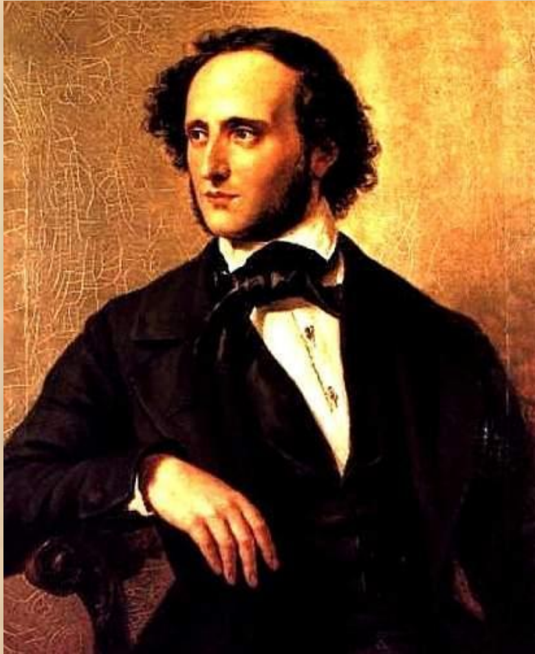
ФЕЛИКС МЕНДЕЛЬСОН (1809 – 1847) – немецкий композитор

ИСКУССТВО. Человек обретает признание и известность, а его работы начинают стоить баснословных денег. Среди самых известных литераторов Франции 13 % были из рабочей среды. Феликс Мендельсон умело организовал, чтобы под его свадебный марш венчались принцесса Германии Виктория и кронпринц Фридрих – император Германии Фридрих III).