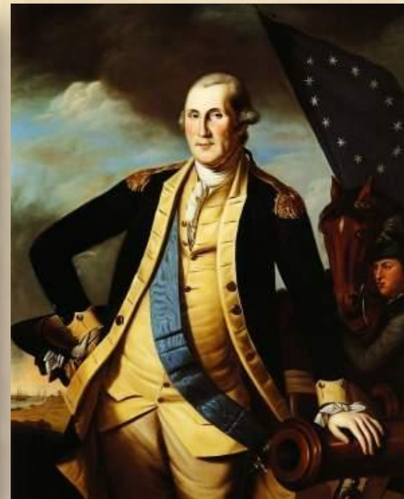
НАПОЛЕОН БОНАПАРТ ОЛИВЕР КРОМВЕЛЬ ДЖОРДЖ ВАШИНГТОН