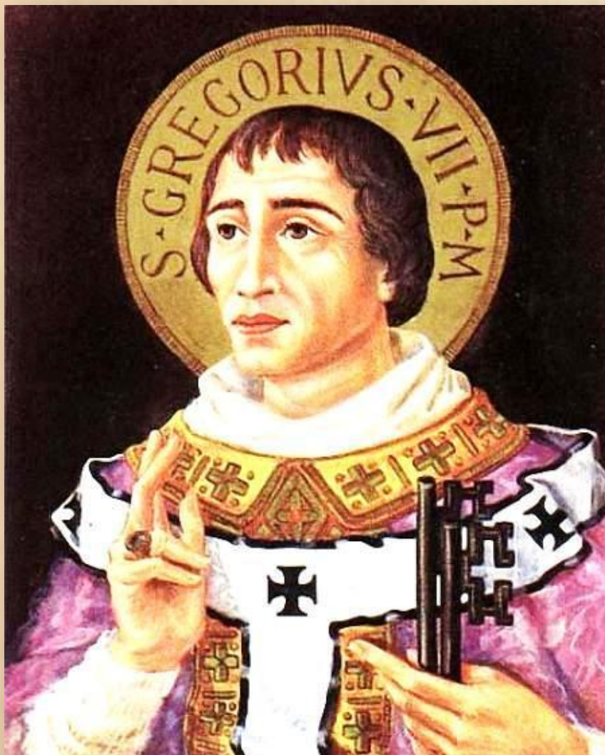
ПАПА ГРИГОРИЙ VII

ЦЕРКОВЬ как канал социальной циркуляции переместила большое число людей с низов до вершин общества. Геббон, архиепископ Реймса, был в прошлом рабом. Папа Григорий VII - сыном плотника. Благодаря институту целибата, после смерти должностных лиц освободившиеся позиции заполнялись новыми людьми.