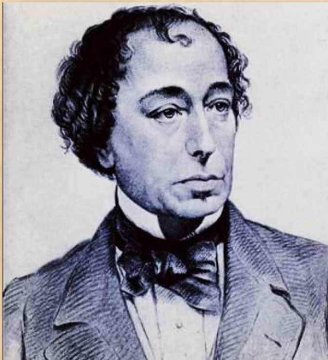
Б. ДИЗРАЭЛИ (1804–1889) – 40-й и 42-й премьер-министр Великобритании

СЕМЬЯ И БРАК. По древнеримскому закону, если свободная женщина выходила замуж за раба, то её дети становились рабами. Сегодня существует «притяжение» богатых невест и бедных аристократов, когда в случае брака оба партнёра получают взаимную выгоду.