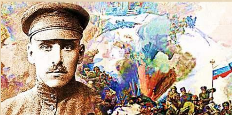
В.К. БЛЮХЕР (1890 — 1938) — маршал Советского Союза