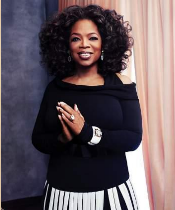
ОПРА УИНФРИ (род. 1954) – американская телеведущая, актриса, продюсер