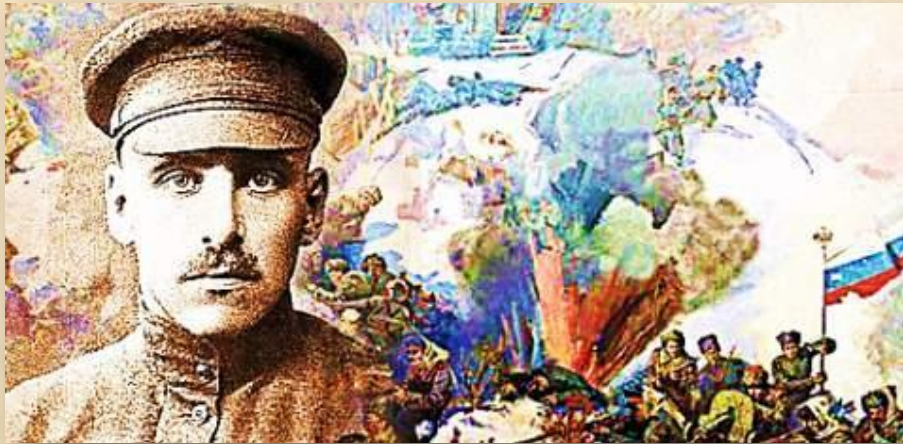
В.К. БЛЮХЕР (1890 — 1938) — маршал Советского Союза