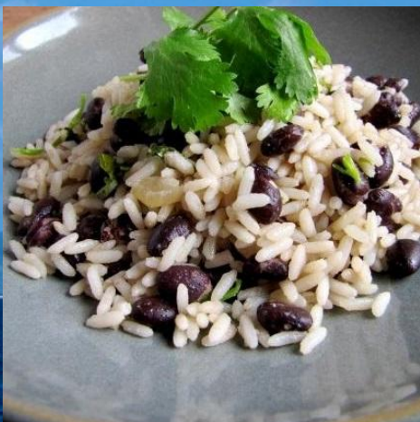
рис с черной фасолью