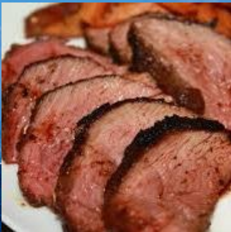
черепашее мясо и мясо крокодила