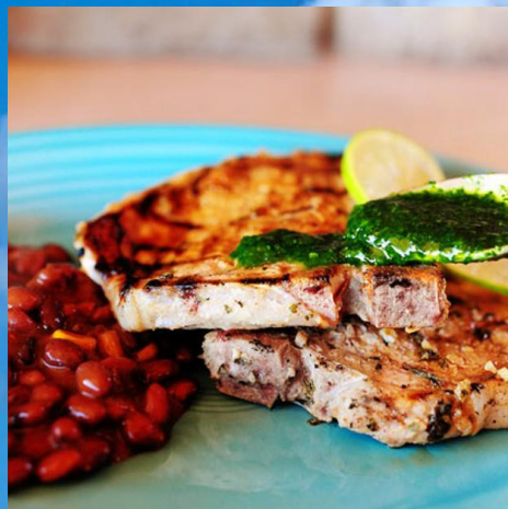
свинина и цыплята