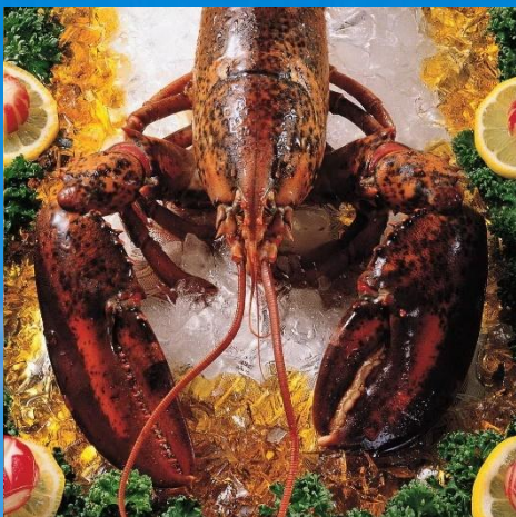
лангусты с лимоном