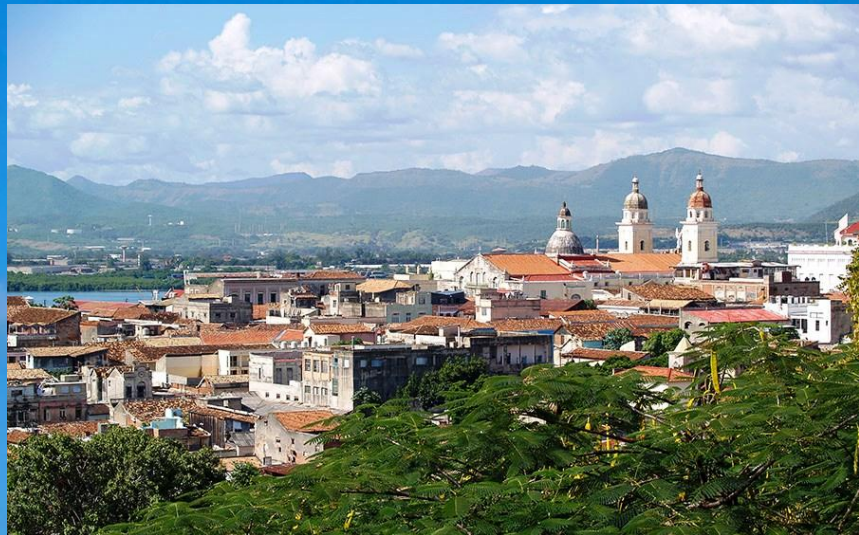
Сантьяго-де-Куба 444 851 человек