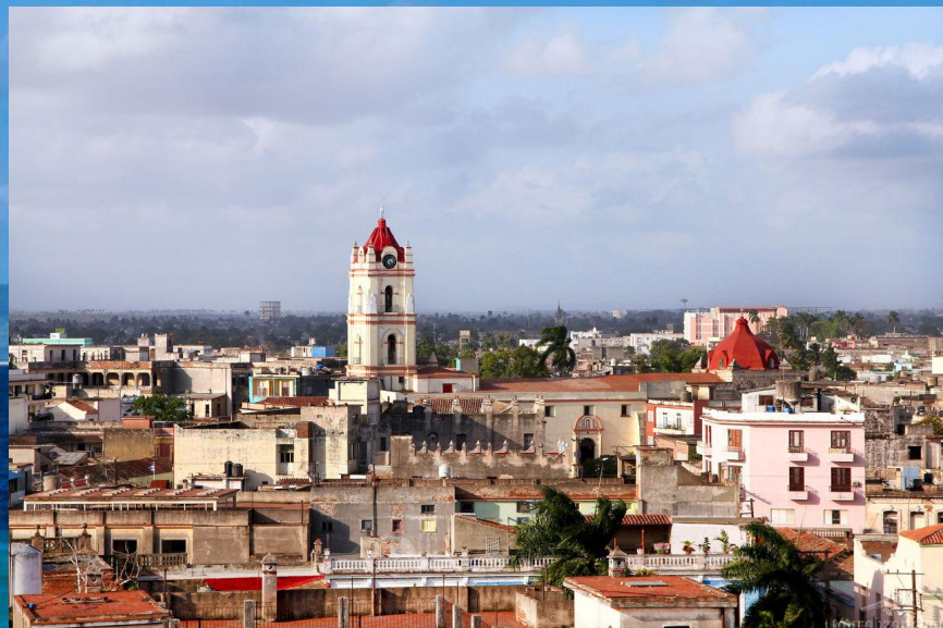
Камагуэй 354 157 челове к