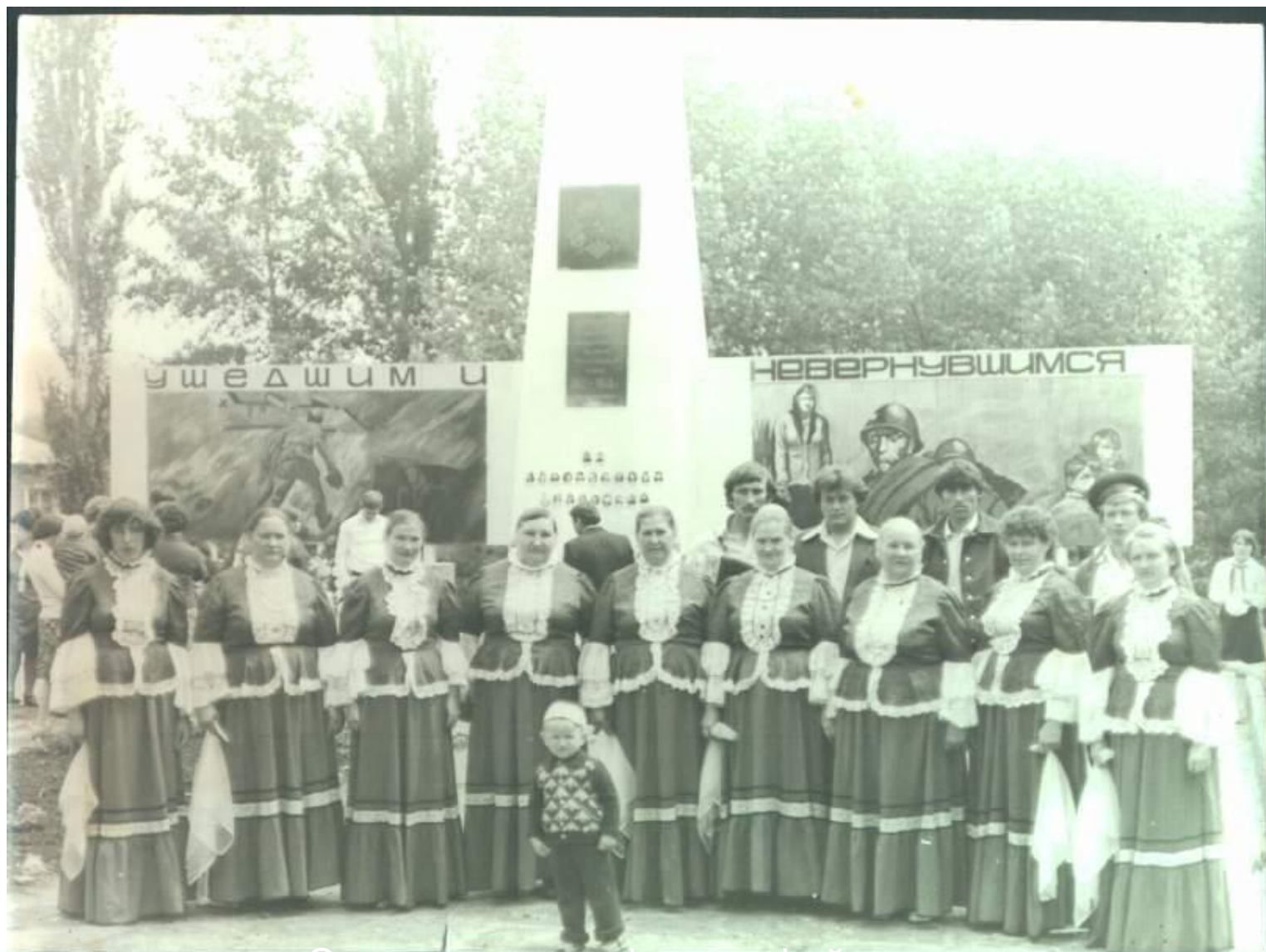
Одна из первых фотографий памятника