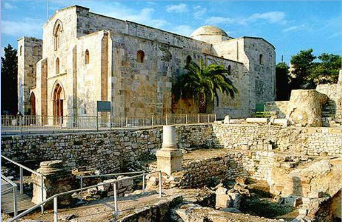
Монастырь Святой Анны