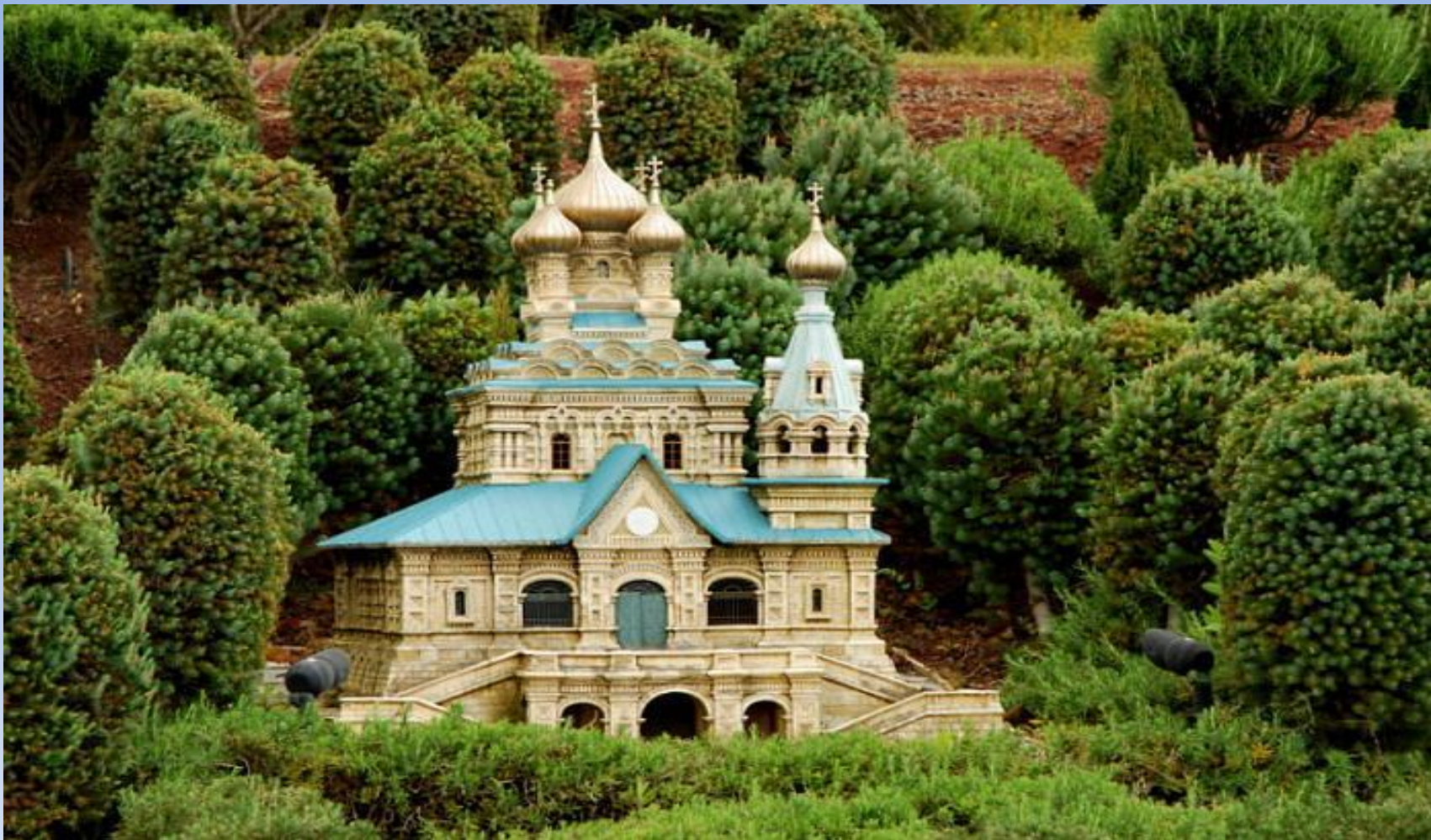
Монастырь Святой Марии Магdalины