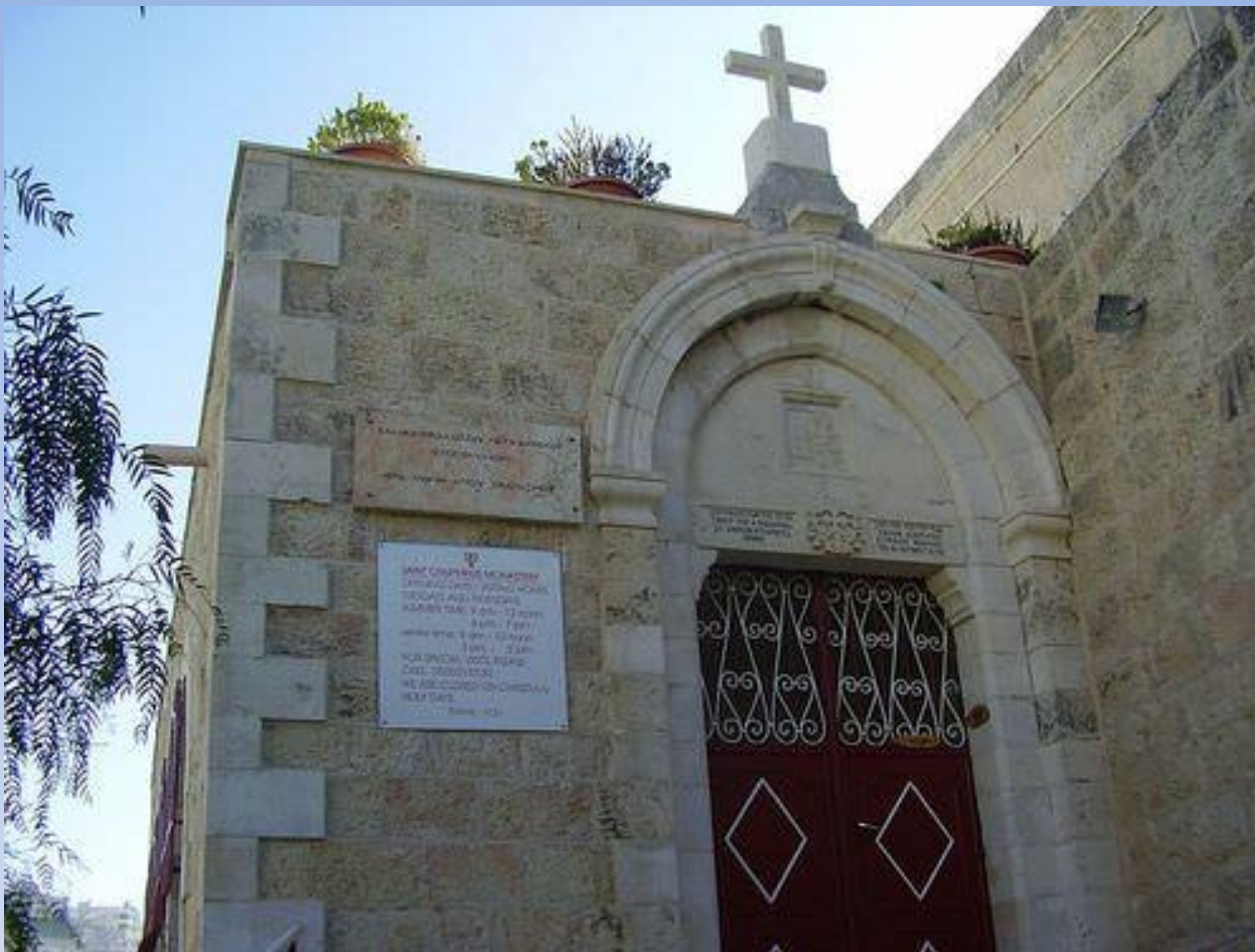
Монастырь Онуфрия Великого