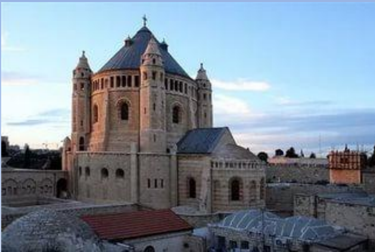
Храм Успение Пресвятой Богородицы