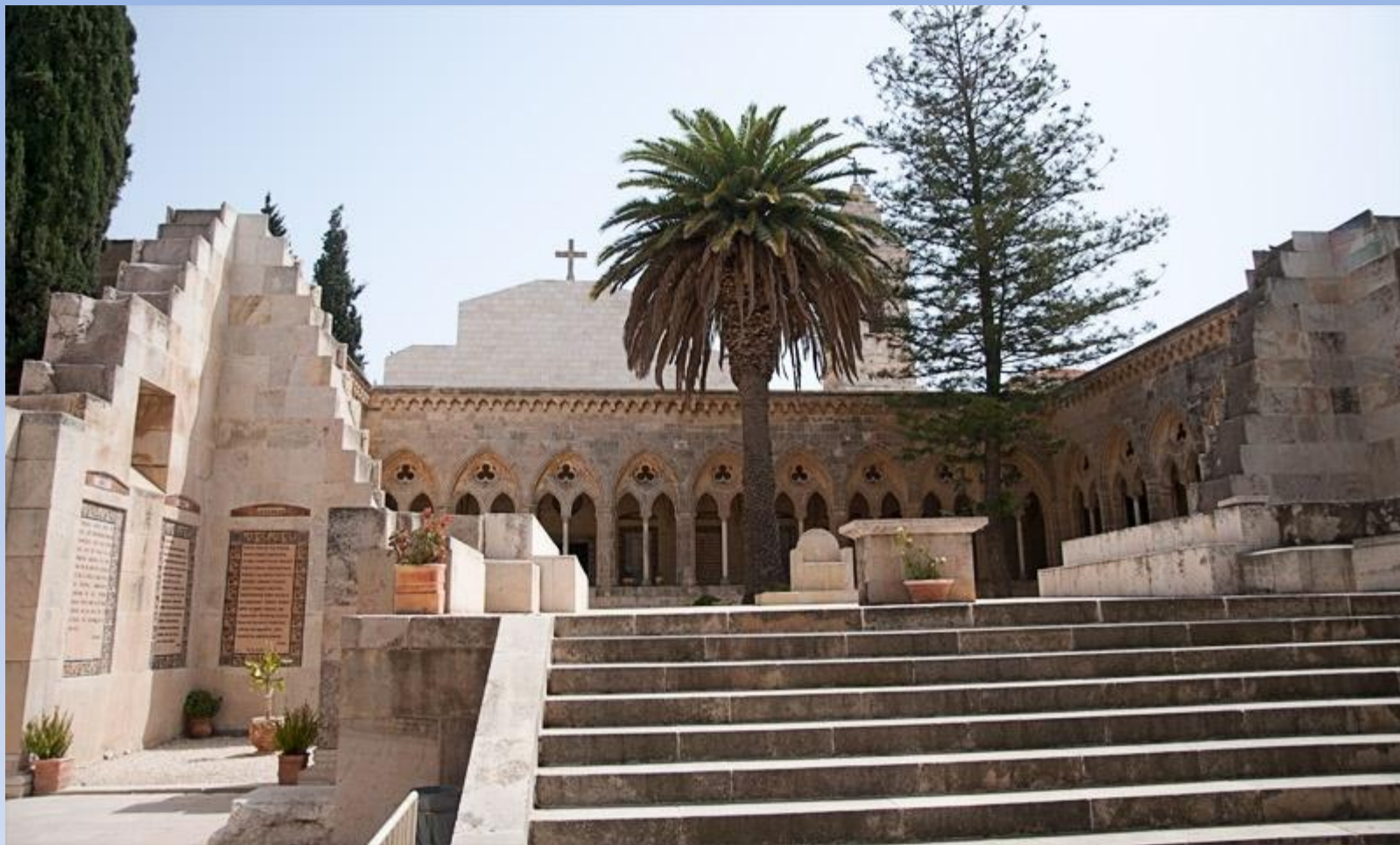
Мужской монастырь Отче Наш