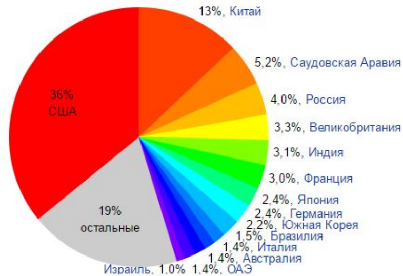
Доля расходов стран на вооружение от мировых