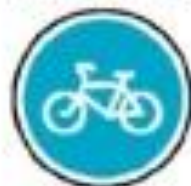
4.4 Велосипедная дорожка