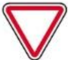
2.4 Уступите дорогу