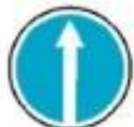
4.1.1 Движение прямо