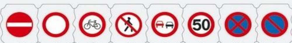
Въезд запрещен, Движение запрещено, Движение на велосипедах запрещено, Движение пешеходов запрещено, Обгон запрещен, Ограничение максимальной скорости, Остановка запрещена, Стоянка запрещена