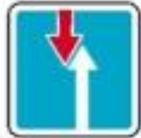
2.7 Преимущество перед встречным движением

Знаки приоритета имеют разную форму и разный цвет. Знаки приоритета устанавливают очередность проезда перекрестков, пересечений проезжих частей или узких участков дороги. Они указывают на то, что некоторые участники дорожного движения имеют преимущество во время движения.