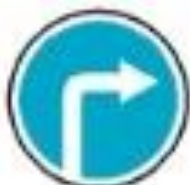
4.1.2 Движение направо