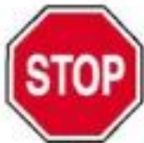
2.5 Движение без остановки запрещено