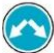
4.2.3 Объезд препятствия справа или слева