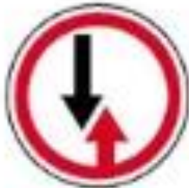
2.6 Преимущество встречного движения