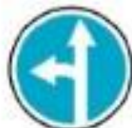
4.1.5 Движение прямо или налево