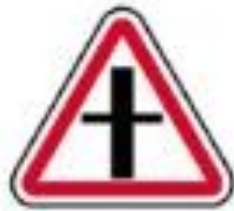
2.3.1 Пересечение с второстепенной дорогой