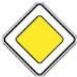
2.1 Главная дорога