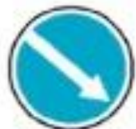
4.2.1 Объезд пре- пятствия справа