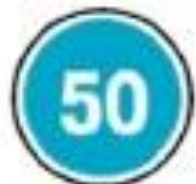
4.6 Ограничение минимальной скорости