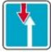
2.7 Преимущество перед встречным движением

Знаки приоритета имеют разную форму и разный цвет. Знаки приоритета устанавливают очередность проезда перекрестков, пересечений проезжих частей или узких участков дороги. Они указывают на то, что некоторые участники дорожного движения имеют преимущество во время движения.