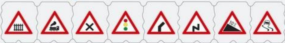
Железнодорожный переезд со шлагбаумом, Железнодорожный переезд без шлагбаума, Пересечение равнозначных дорог, Светофорное регулирование, Опасный поворот, Опасные повороты, Крутой спуск, Сельская дорога