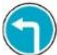
4.1.3 Движение налево