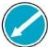
4.2.2 Объезд препятствия слева