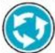
4.3 Круговое движение