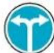
4.1.6 Движение направо или налево