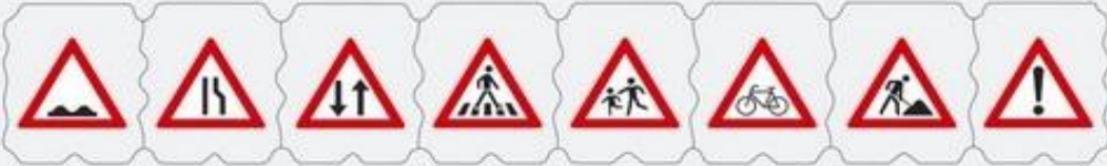
Нarrow road ahead, Сужение дороги, Двустороннее движение, Пешеходный переход, Дети, Пересечение и велосипедной дорожкой, Дорожные работы, Прочие опасности