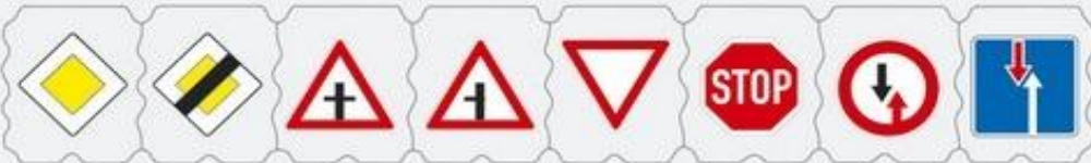
Главная дорога, Конец главной дороги, Пересечение со второстепенной дорогой, Приоритет второстепенной дороге, Уступите дорогу, Движение без остановки запрещено, Преимущество встречного движения, Преимущество перед встречным движением