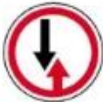
2.6 Преимущество встречного движения