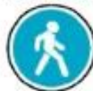
4.5 Пешеходная дорожка