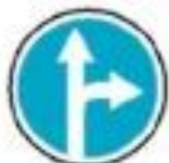
4.1.4 Движение прямо или направо