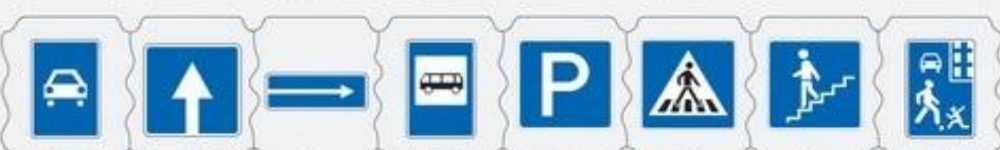
Дорога для автомобилей, Дорога с односторонним движением, Выход на дорогу с односторонним движением, Место остановки автобуса и (или) троллейбуса, Место стоянки, Пешеходный переход, Пешеходный переход, Жилая зона