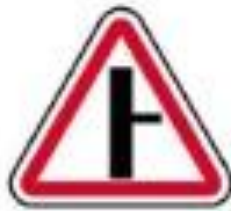
2.3.2 Примыкание второстепенной дороги