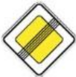
2.2 Конец главной дороги