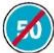
4.7 Конец ограничения минимальной скорости