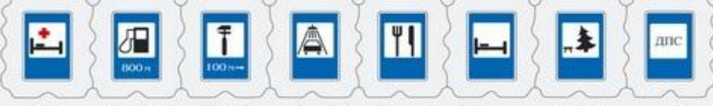
Больница, Актельная станция, Техническое обслуживание автомобилей, Мытьё автомобилей, Пункт питания, Гостиница или мотель, Место отдыха, Пост ГАИ