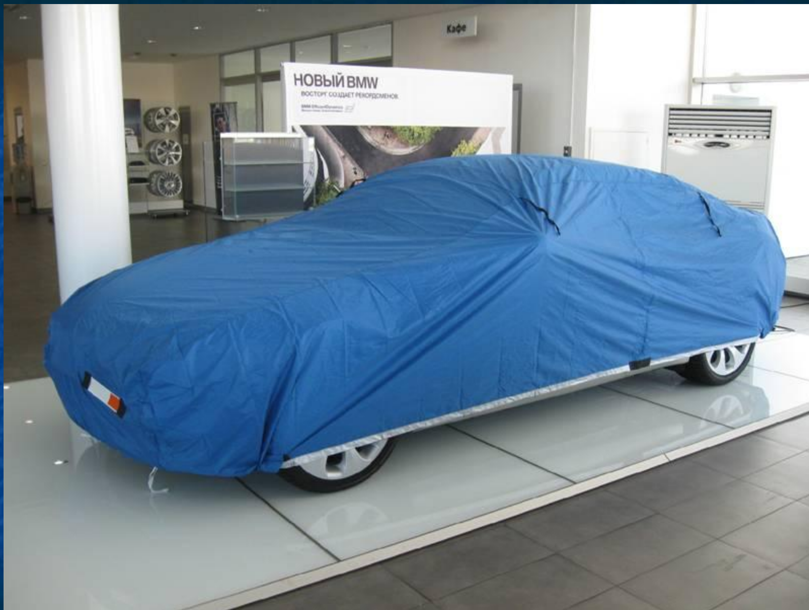
Чехол МК-49-12-18-16 на BMW 6 купе