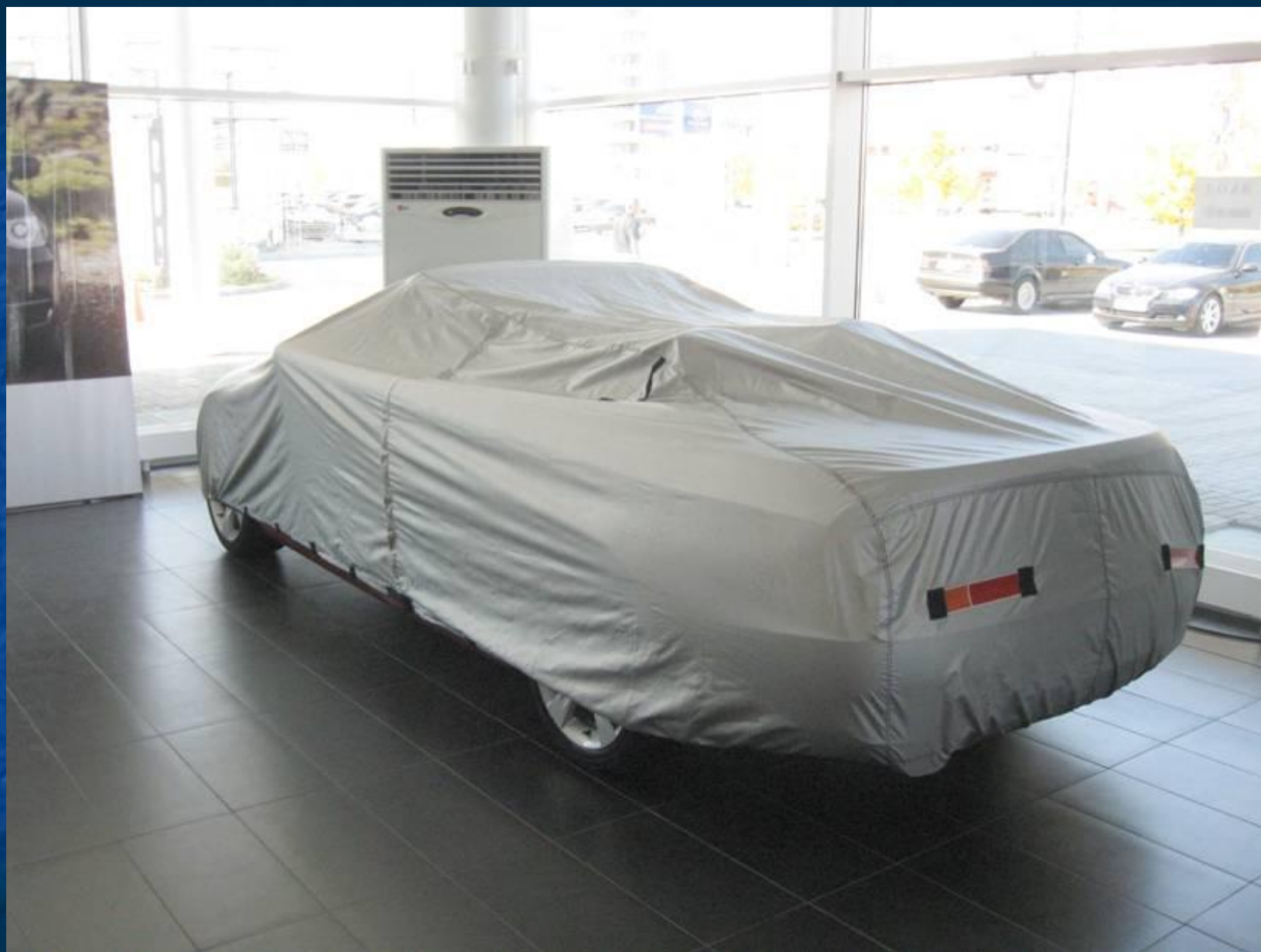
Чехол МК-46-11-18-17 на BMW 3 серии Cabrio