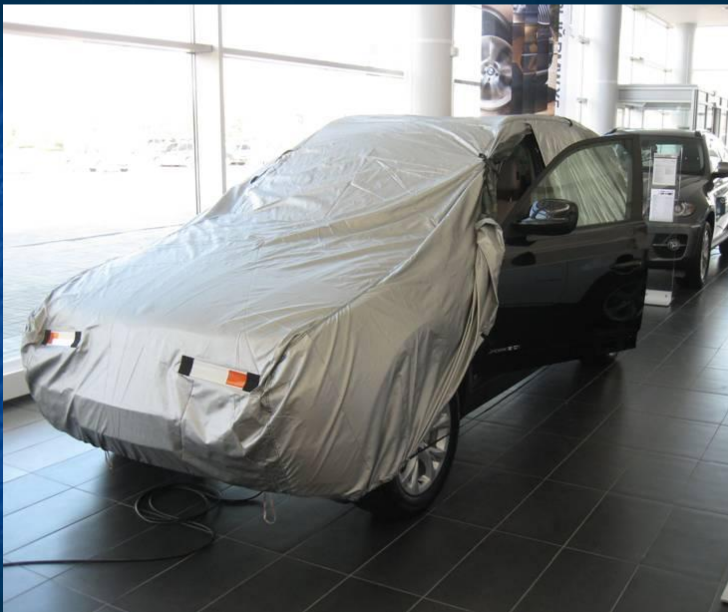
Чехол МК-46-05-18-18 на BMW X3