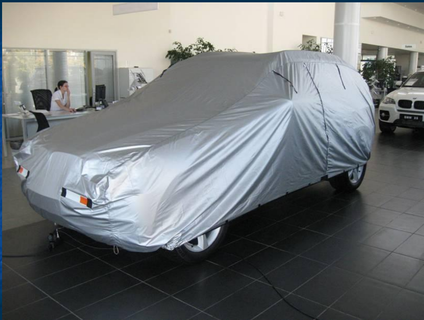
Чехол МК-49-05-18-18 на BMW X5