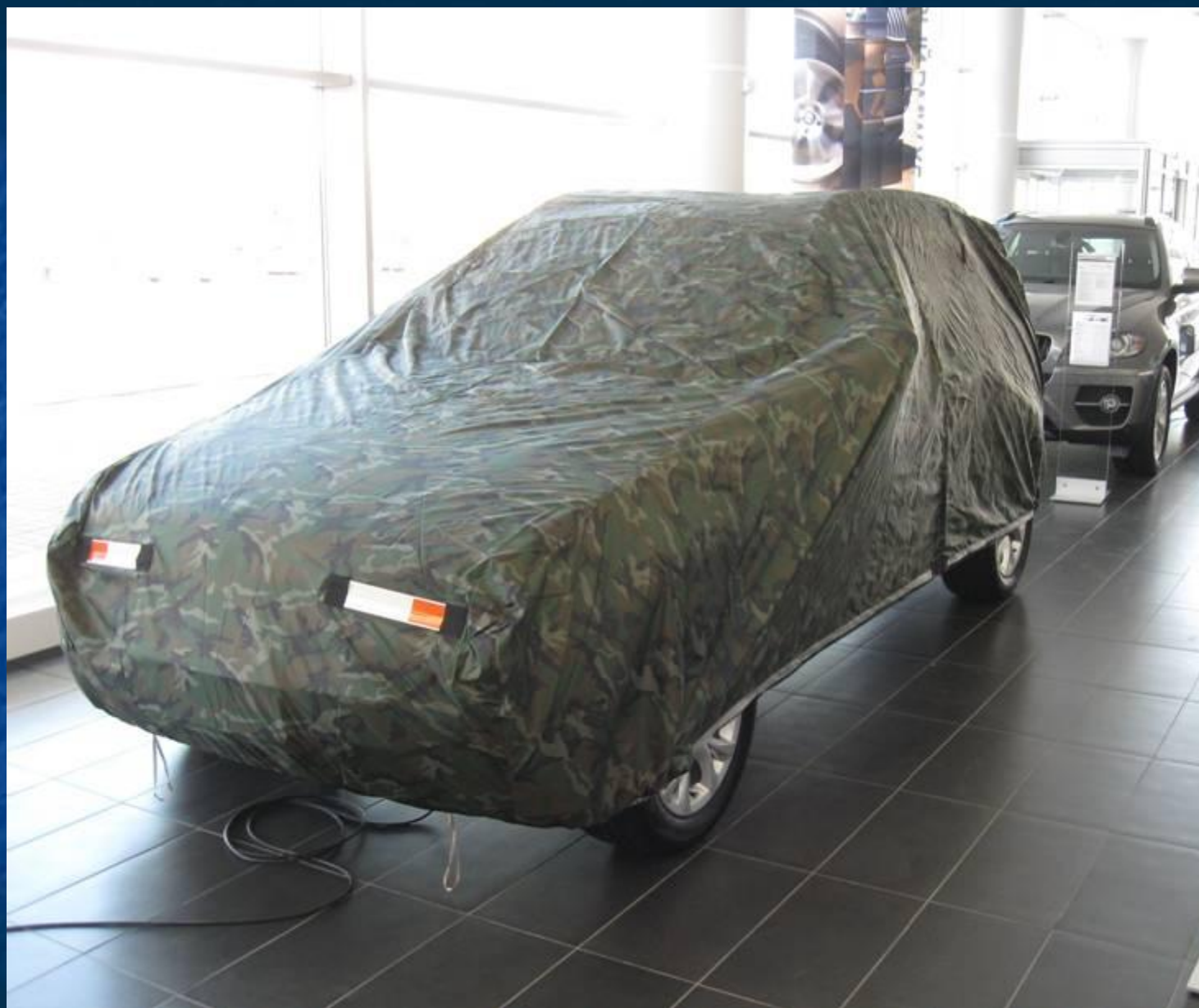
Чехол МК-46-05-18-18 на BMW X3