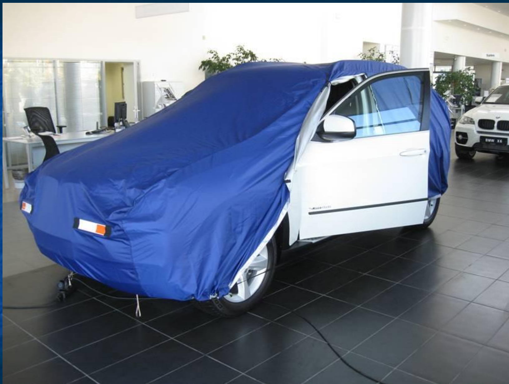
Чехол МК-49-05-18-18 на BMW X5