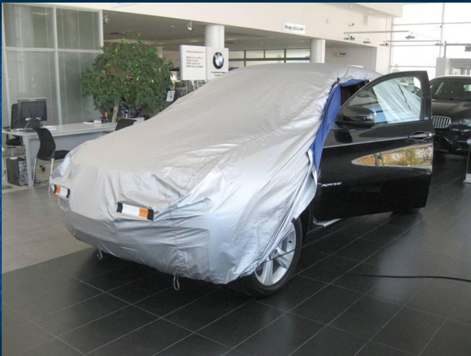
Чехол МК-49-05-18-18 на BMW X6