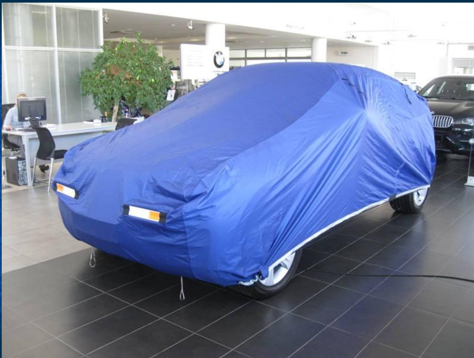
Чехол МК-49-05-18-18 на BMW X6