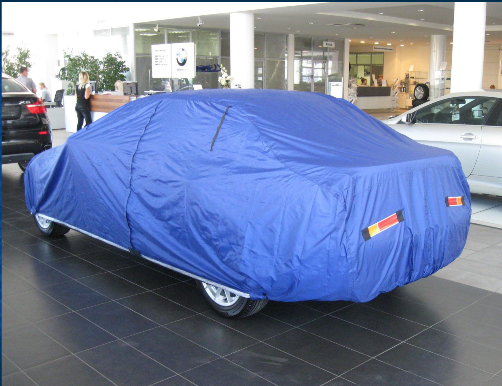
Чехол МК-46-11-18-17 на BMW 3 седан