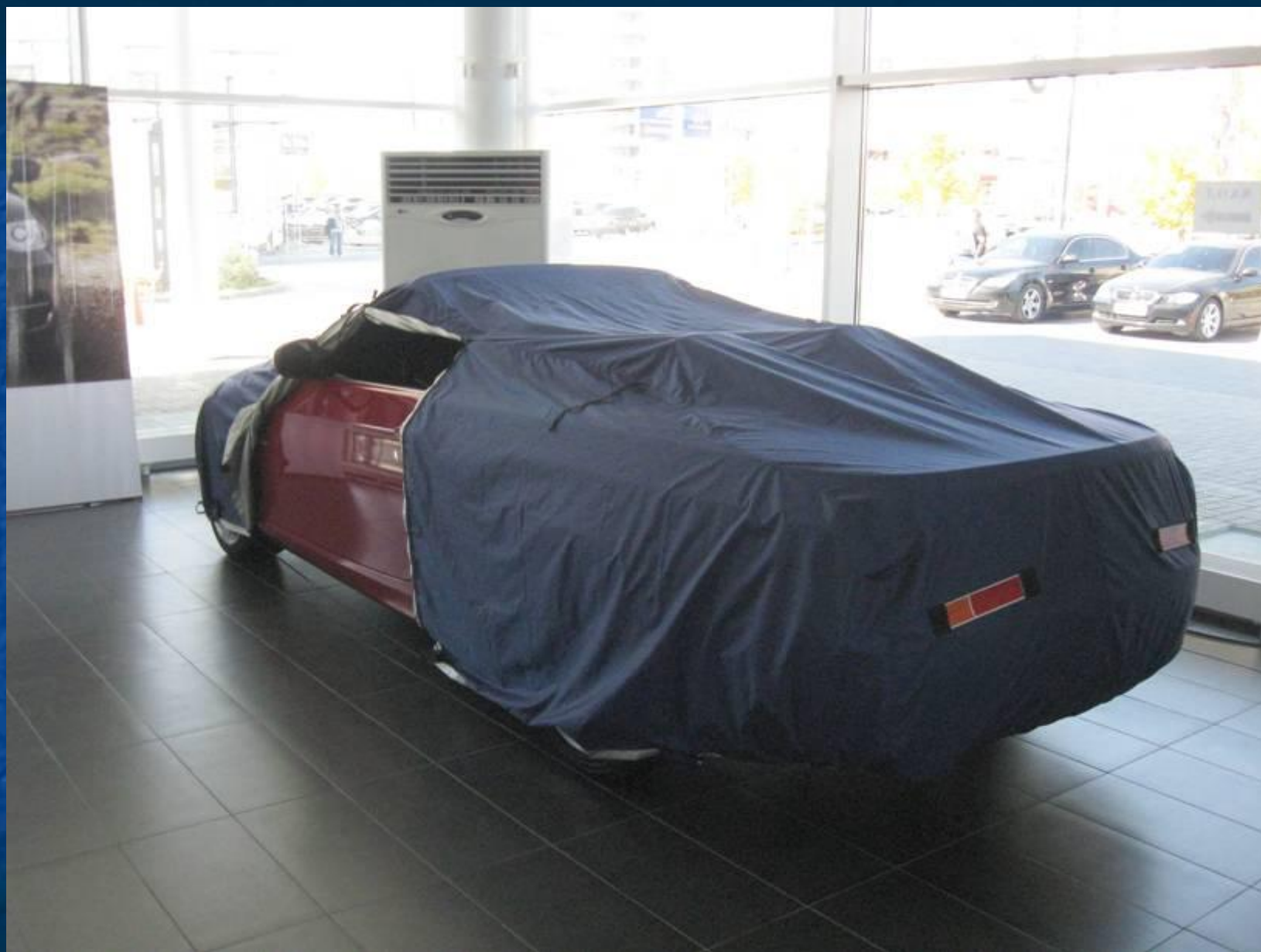
Чехол МК-46-11-18-17 на BMW 3 серии Cabrio