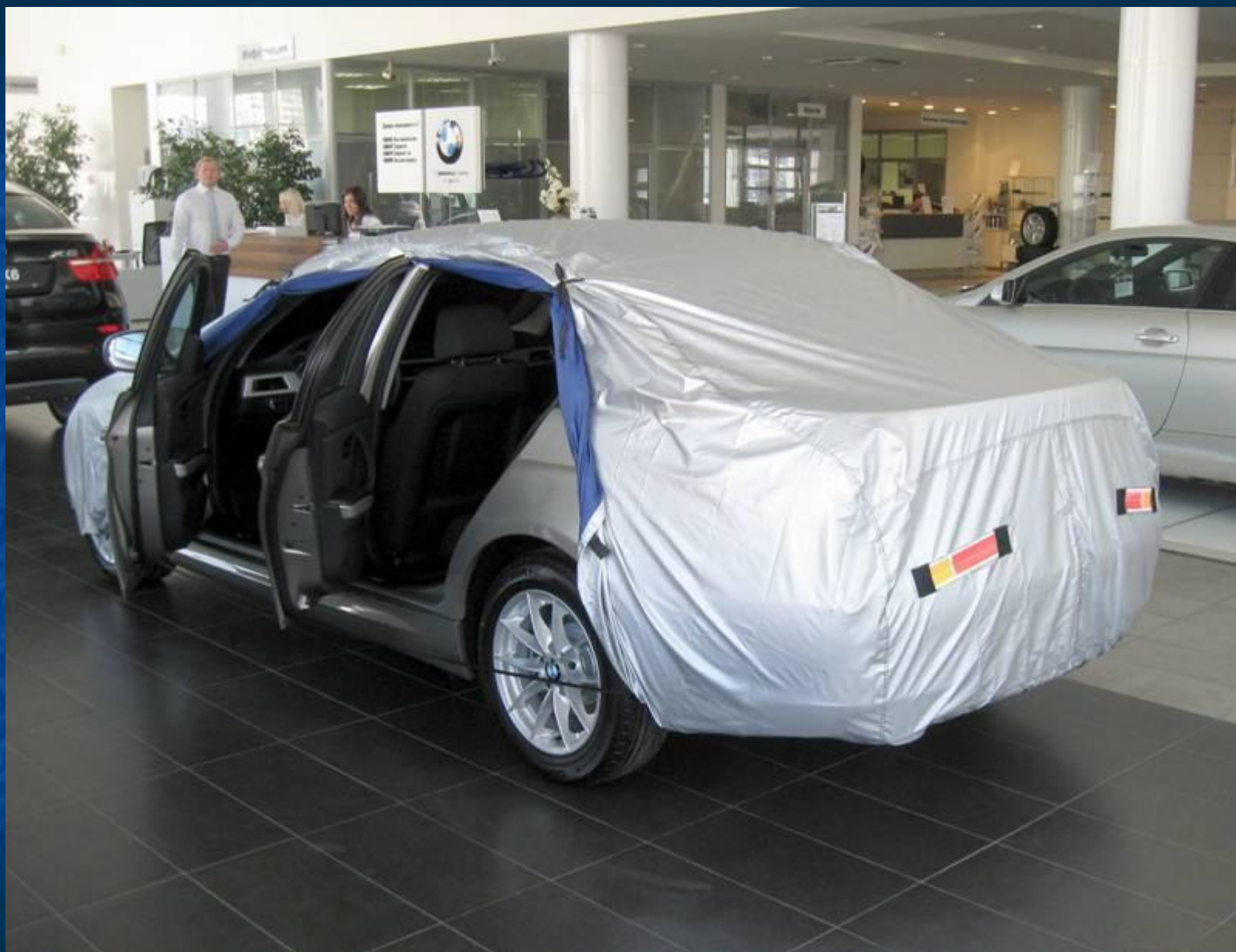
Чехол МК-46-11-18-17 на BMW 3 седан