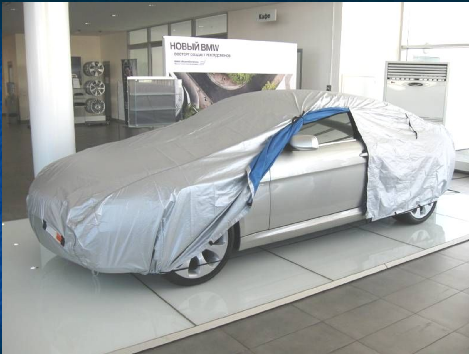
Чехол МК-49-12-18-16 на BMW 6 купе