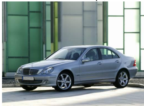
Премиум - 1300 р./нч