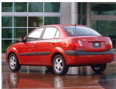
Эконом - 900 р./нч