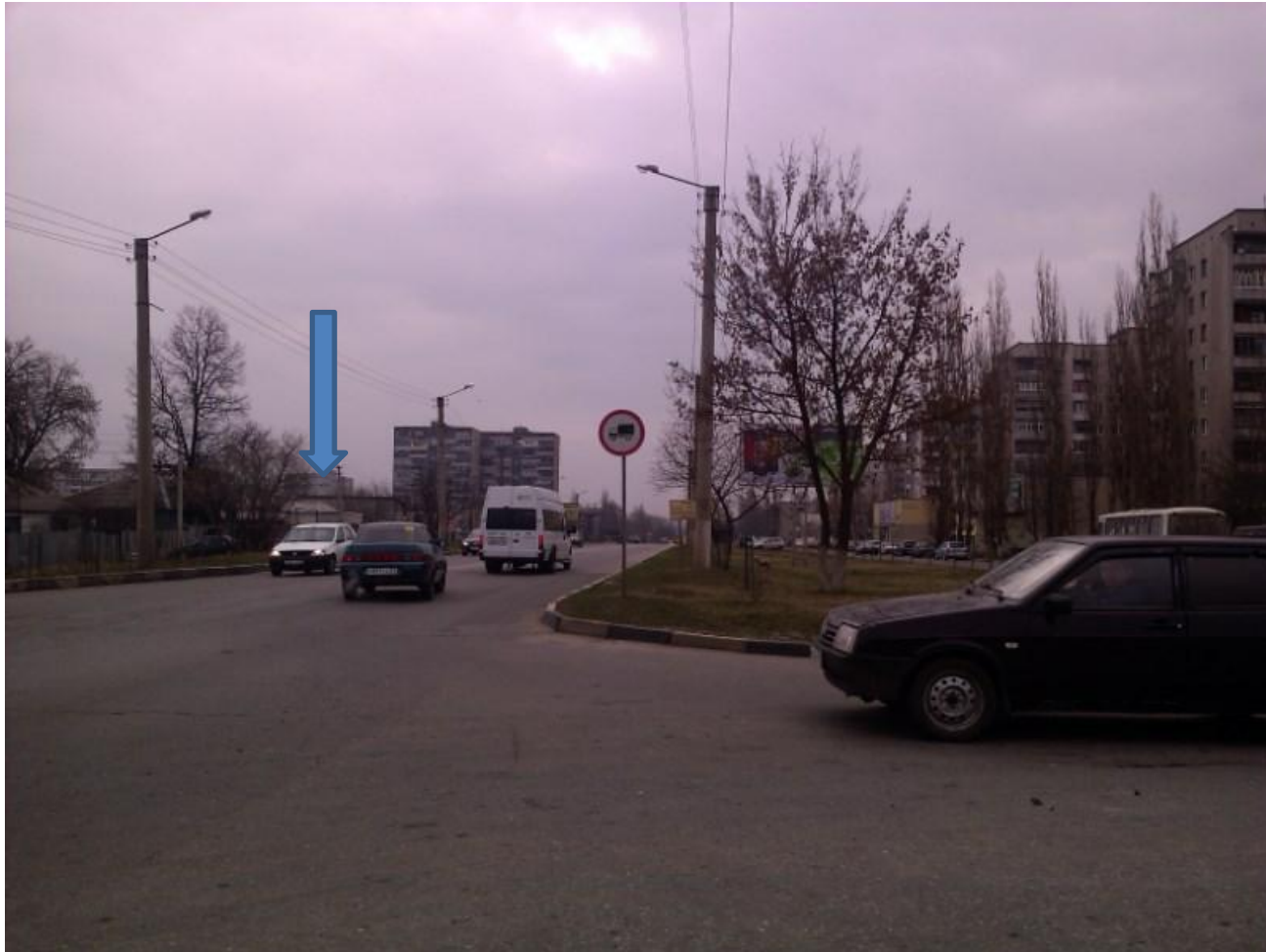
Вид на ТЦ Европа