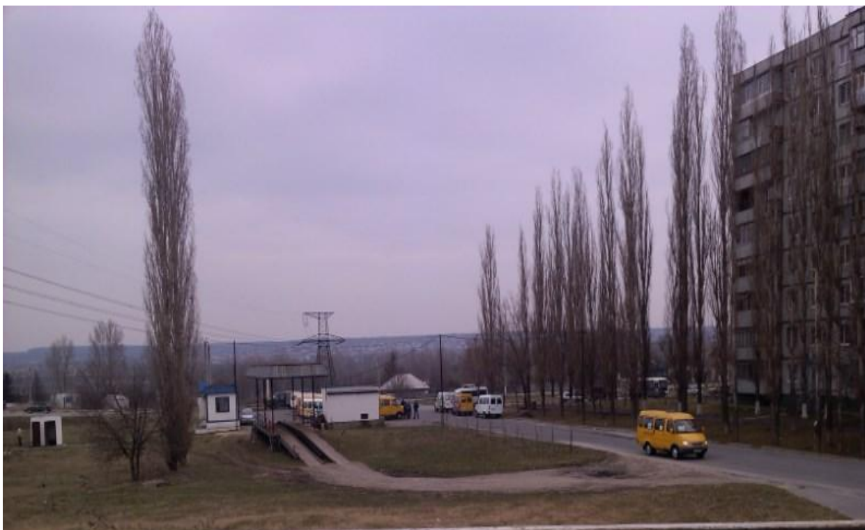
Вид от объекта