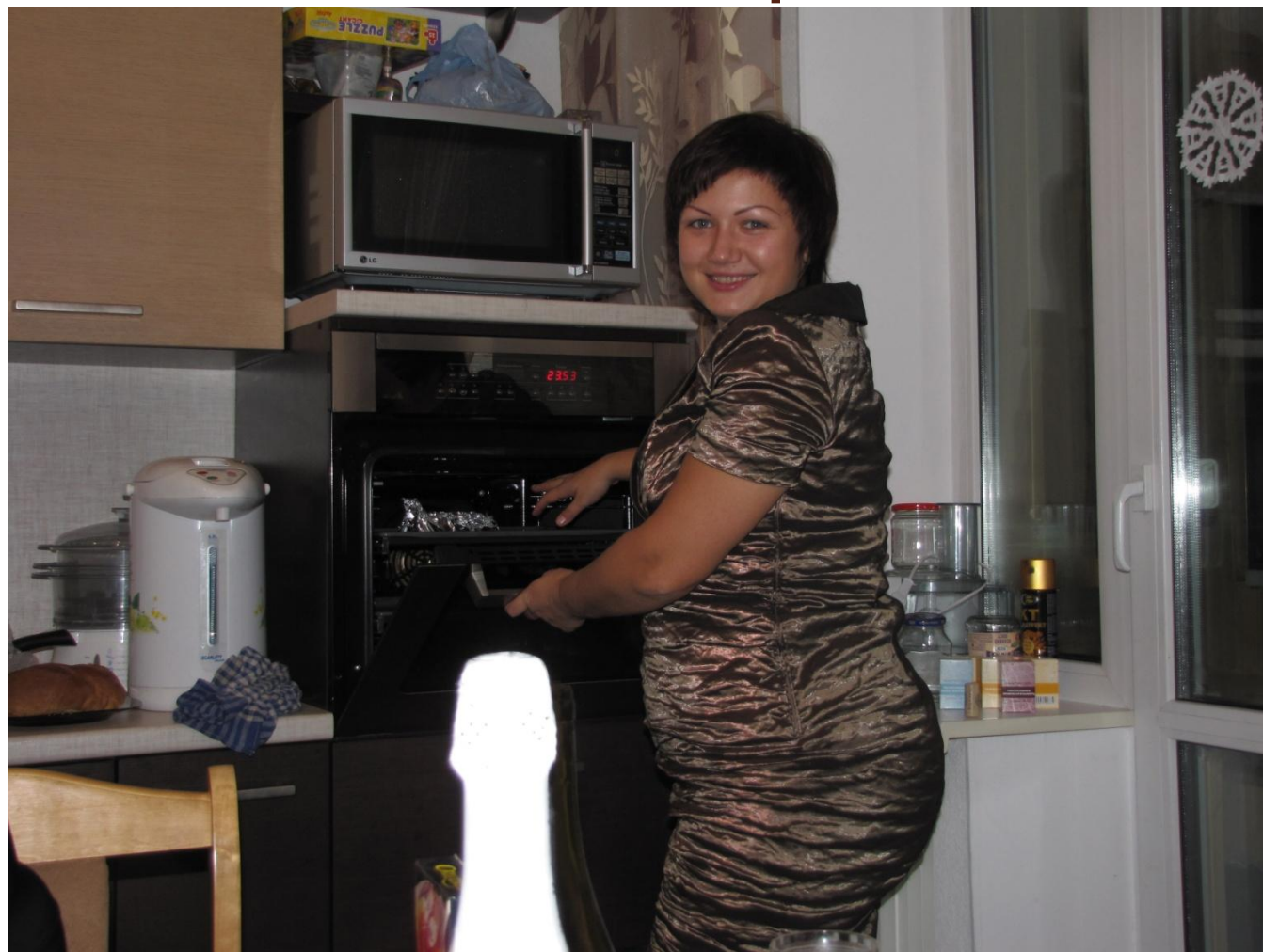
Фотография 1 января 2010

Как Вы знаете еще в начале 2010 года мой вес был порядка 90 кг.