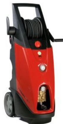
АВД аппарат высокого давления