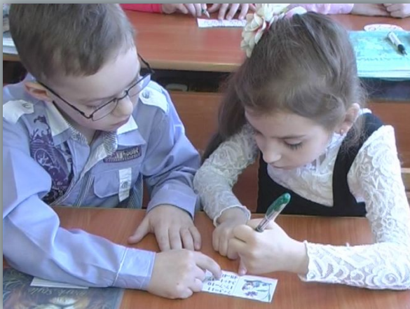
робота в парах