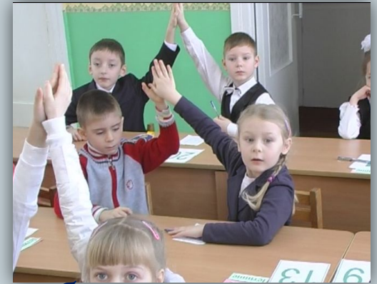
робота в малих групах