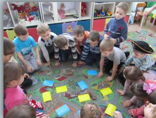
робота в групах