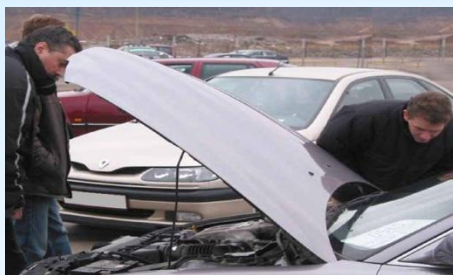
Подержанная иномарка Каско на 1 год