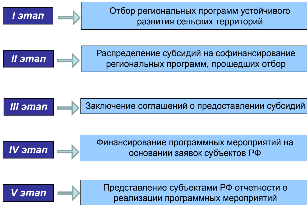
Схема реализации ФЦП «Устойчивое развитие сельских территорий на 2014-2017 годы и на период до 2020 года»