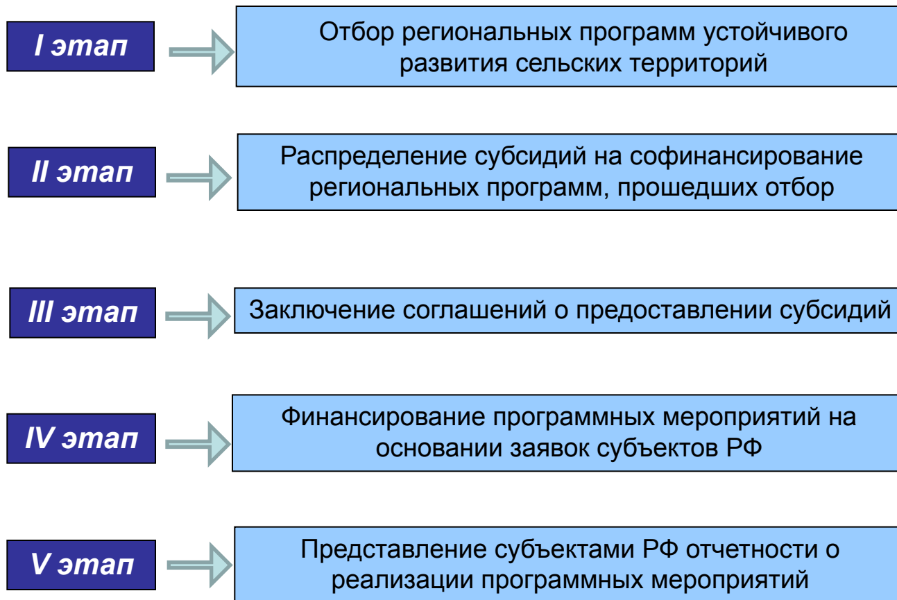
Схема реализации ФЦП «Устойчивое развитие сельских территорий на 2014-2017 годы и на период до 2020 года»