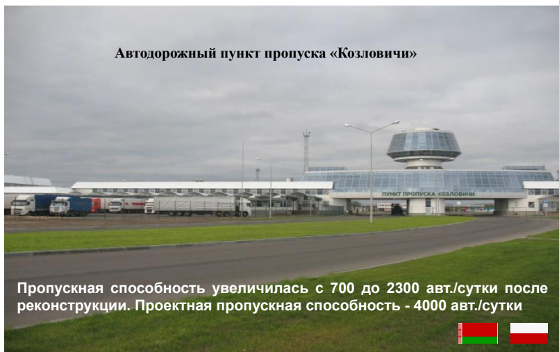
Автодорожный пункт пропуска «Козловичи»

Пропускная способность увеличилась с 700 до 2300 авт./сутки после реконструкции. Проектная пропускная способность - 4000 авт./сутки