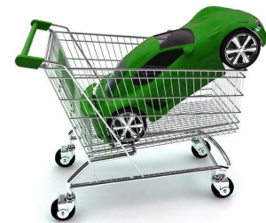
Схема работы «Автомобильный риелтор»