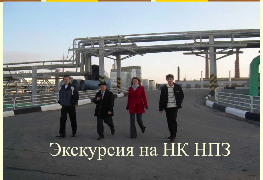
Экскурсия на НК НПЗ