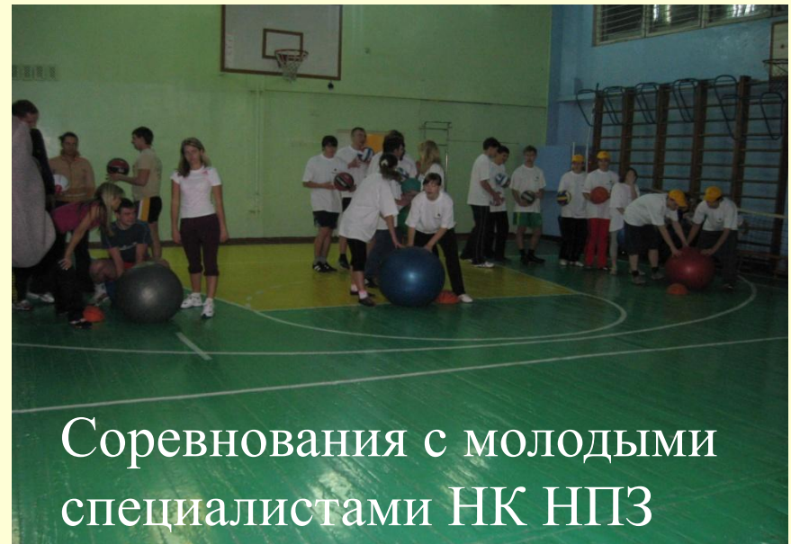
Соревнования с молодыми специалистами НК НПЗ