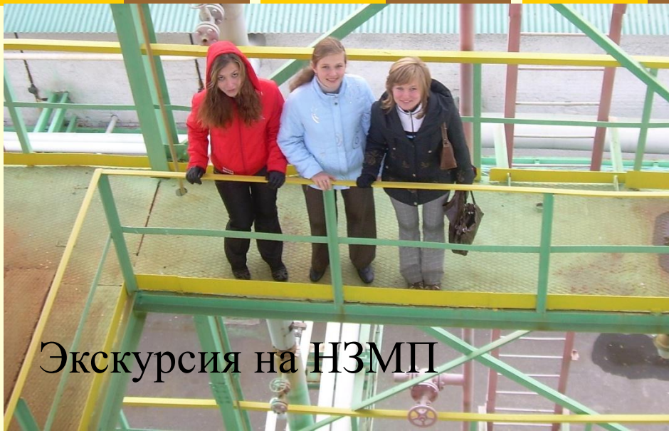
Экскурсия на НЗМП