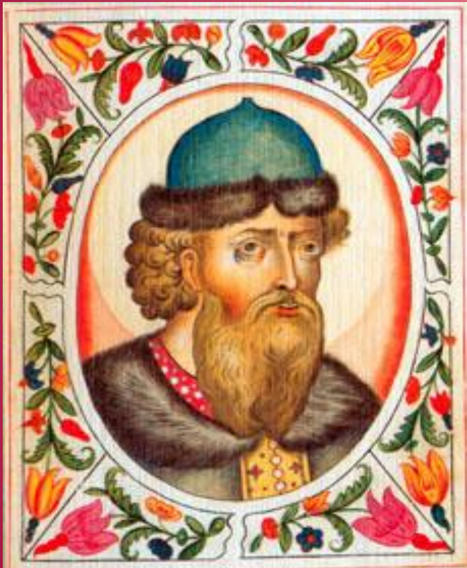
Великий князь киевский Владимир II Всеволодович Мономах

1113 г.- подавив народное восстание в Киеве, занял великокняжеский престол и смягчил степень эксплуатации крестьян; Объединил \frac{3}{4} территории Руси, прекратив на ней междоусобицы. Совершил 85 успешных походов, остановил натиск половцев на Русь, нанеся им ряд крупных поражений в глубине их территорий. Автор «Поучения Владимира Мономаха».