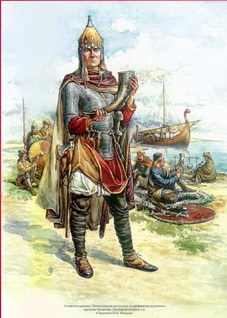
Киевский дружинник. Реконструкция выполнена по материалам дружинных изображений «Скандинавская летопись» Х в.

907 г. – торговый договор, который содержал выгодные для русских купцов условия; 911 г. – первый письменный договор