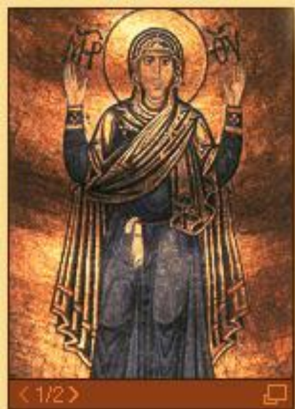
Богоматерь Оранта ("Нерушимая стена")