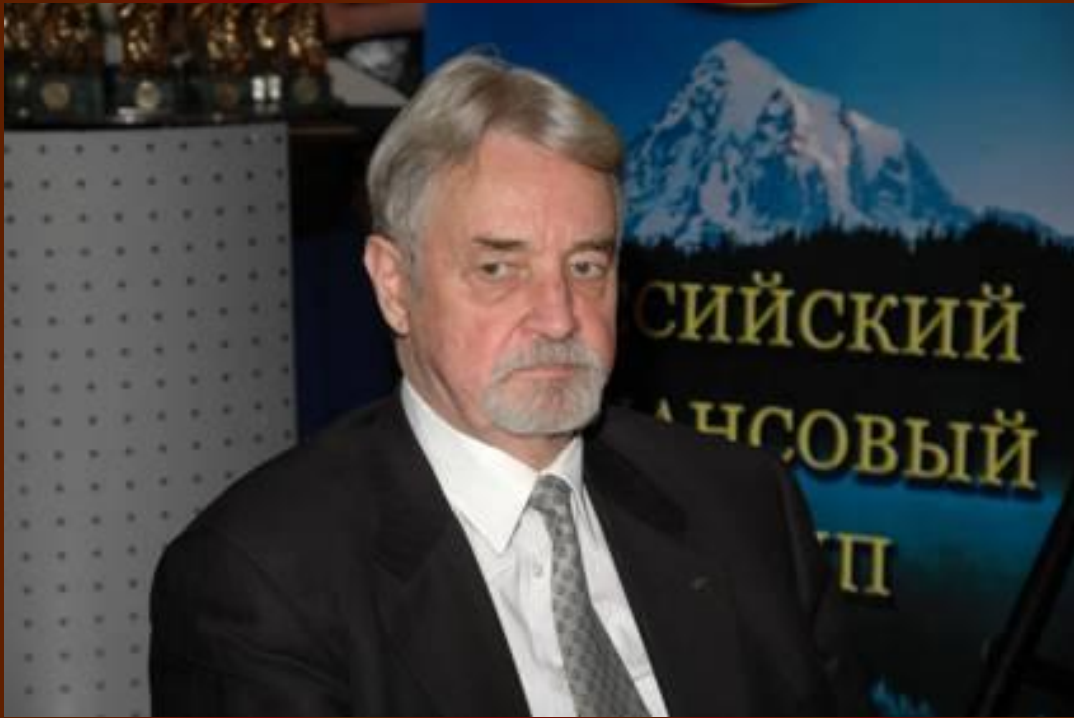
Гнедовский Ю.П., (Президент Союза архитекторов РФ, академик Российской академии архитектуры и строительных наук, лауреат Государственных премий )