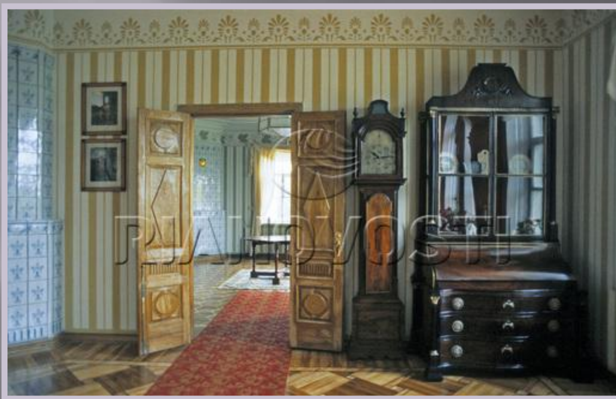
В доме – музее в Васильевке

Семья большая (шестеро детей), дружная, культурная: отец писал комедии, в доме устраивались театральные постановки, на которые приглашались гости. Сам Гоголь в детстве писал стихи, мать заботилась о религиозном воспитании сына