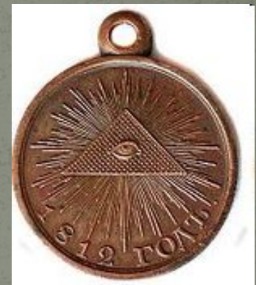
I I степени для купечества и дворянства